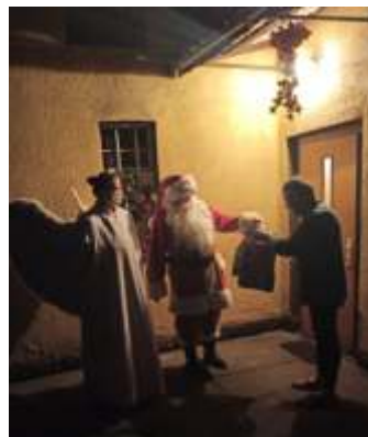
Mikołaj z aniołem wr czaj paczk

O rodek Pomocy Społecznej w Mszanie we współpracy z Fundacją JSW, przygotował dla osób samotnych, z niepełnosprawnymi oraz dzieci z rodzin najuboższych i uczyszczających do wietlicy rodowiskowej w Połomi paczki wi teczne, z doł czonym gminnym kalendarzem na rok 2021 oraz yceniami. Ze wzgl du na trwaj c epidemi , w grudniu nie odbylo si tradycyjne spotkanie opłatkowe, ale paczki zostały rozwiezione do podopiecznych przez w. Mikołaja i jego pomocników lub opiekunowie odebrali je osobi cie. Taki upominek tu przed Bo ym Narodzeniem ot-