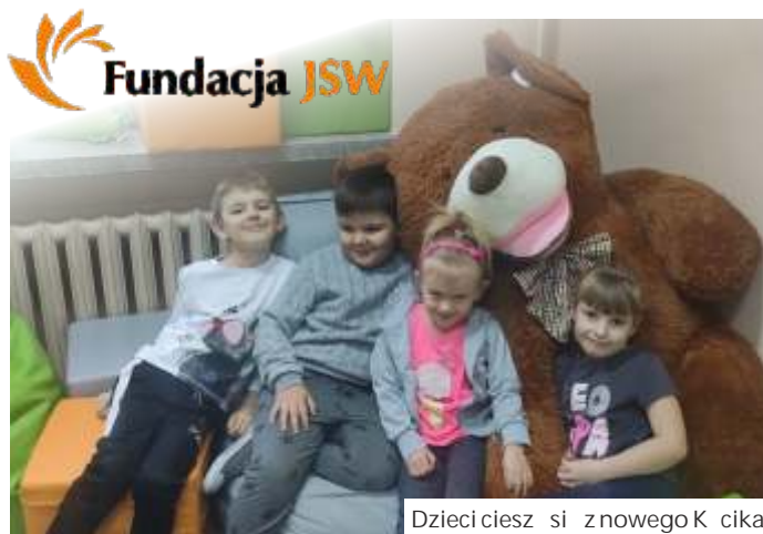
Dzieci cieszą się z nowego Kciuka

- Przyjazny kciuk to nowoczesny, profesjonalny gabinet, w którym nasi uczniowie będą mogli uczestniczyć w zajęciach z pedagogiem i psychologiem. Miejsce jest przyjazne i otwarte dla każdego ucznia, rodzica, nauczyciela. Dzięki dotacji po-