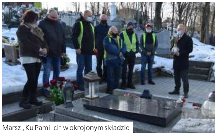
Marsz „Ku Pamięci” w okrojonym składzie