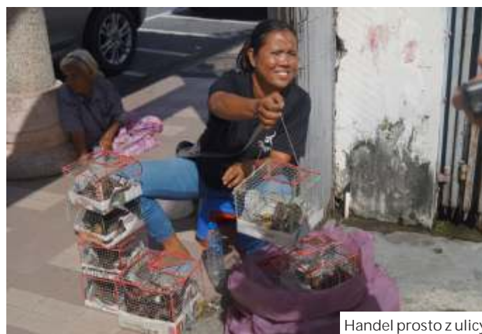
Handel prosto z ulicy

Gdy nadarzyła się możliwość zaoszczędzenia, za nocleg płacili pracownikami. - Miałam już wcześniej zamiar na polską rodzinę, mieszkającą w Bahiji. Starsi ludzie, którzy wiele lat pracowali w Stanach Zjednoczonych, a potem przenieśli się do Ekwadoru. Kupili tam 16 hektarów ziemi... dokończcie na str. obok