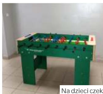
Na dzieci czekają