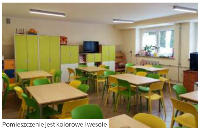
Pomieszczenie jest kolorowe i wesołe

- Mamy również nowy sprzęt nagłaśniający wraz z dwoma mikrofonami oraz magnetofon. Zakupione zostały też liczne płyty z nagraniami piosenek