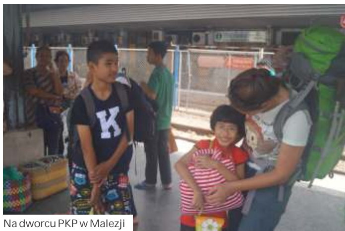
Na dworcu PKP w Malezji

W Andach czy na Kordylierze Białej nie ma tych szlaków turystycznych w europejskim znaczeniu. - Tam jedynym punktem odniesienia jest kopczyk kamień