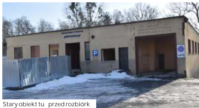
Stary obiekt tu przed rozbiórką

W centrum Gogołowej rusza potężna inwestycja związana z rewitalizacją tego miejsca. W ramach zadania do końca stycznia przyszłego roku ma tutaj powstać nowoczesny obiekt wielofunkcyjny dla potrzeb kulturalnych i sportowych, z salami widowiskowymi, pomieszczeniami dla Izby Regionalnej i Koła Gospody Wiejskich.