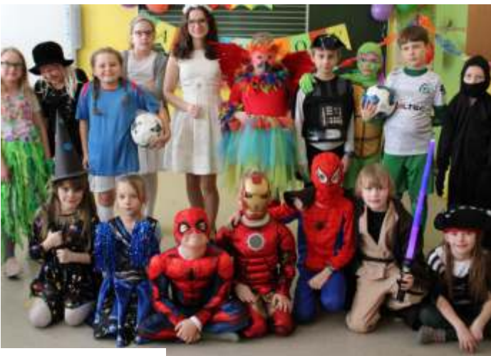
Baliki w SP w Mszanie

ruchową, do logopedy i na hipoterapię. Od dziecka jeździ na wózku, porusza się z pomocą drugiej osoby. Rodzina walczy o jej jak najwięcej samodzielności. KRS na ulotce powyżej.