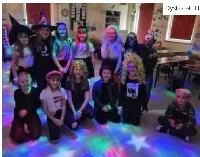
Dyskoteki i bale w Połomi

W przedszkolu Wesoły Dzwoneczek w Mszanie wielki bal karnawałowy odbył si 11 lutego. Dzieci oraz ich panie przebrane były za bohaterów znanych bajek, tu tak e wida byto, e najwi ksze wziecie w tym roku miały kostiumy mundurowych, a w ród dziewczynek ksi niczek, wró ek i biedronek. Tu równie zawitała gminna telewizja, a relacj mo na obejrze na kanale You Tube. (mk) Zdj cia tak e na str. 16