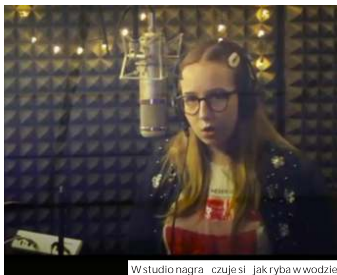
W studio nagrań czuje się jak ryba w wodzie

Muzycznie 14-latką dostała wiary w genach. Ale oprócz muzycznych marzeń ma też bardzo realne podejście do życia. Dlatego po podstawówce przymierza się do szkoły ekonomicznej. - Śpiewa i tak zawsze mogę. A nie zaszkodzi mi w zapasie czegoś innego - mówi, głaszcząc domowego pupila - kota Rafika. (mk)