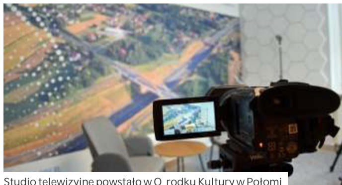
Studio telewizyjne powstało w Ośrodku Kultury w Połomi

Fundusze na sprzęt przekazała w ramach projektu Fundacja Jastrzębskiej Spółki Węglowej, natomiast remont pomieszczenia przeprowadzono ze środków własnych. Przewidywane koszty wyniosły nieco ponad