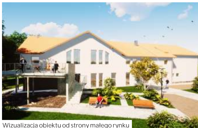
Wizualizacja obiektu od strony małego rynku

Bryła nowego obiektu kształtem będzie zbliżona do prostokąta o wymiarach 42 na 15 metrów. Powierzchnia użytkowa to 1078 metrów kw., kubatura - 5700 m 3 . Obok budynku zaplanowano mały rynek jako przestrzeń ogólnodos-