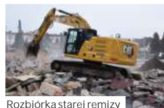
Rozbiórka starej remizy

temem "projektuj i buduj". Wartość umowy - 6,7 mln zł brutto (w tym 246 tys. zł sam projekt). Na rewitalizację gmina przeznaczyła dotację w kwocie 4 mln zł z Rozdowego Funduszu Inwestycji Lokalnych. - Inwestycja jest kosztowna, ale udało nam się pozyskać dofinansowanie, co znacznie odciąży budżet - mówił na komisji wójt M. Szymanek. Zasygnalizował także o możliwości przedłużeniu zakończenia prac do czerwca 2022 roku. Obecny termin upływa w styczniu 2022 r. Przesunięcia byłyby zasadne, ponieważ ograniczenia związane z COVID-19 spowodowały opóźnienia przy uzyskiwaniu pozwoleń o 4 miesiące. Również warunki pogodowe nie ułatwiają firmie zadania. (mk)