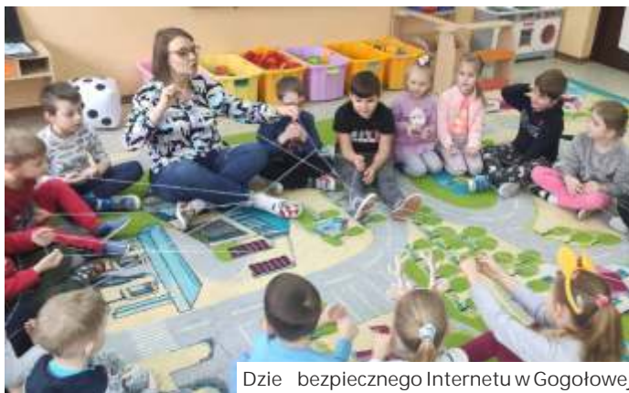
Dzieci bezpiecznego Internetu w Gogołowej

W Mszanie akcja odbyła się pod hasłem: „Cisza! Tu się gra w planszówki”. Na swoim profilu facebookowym szkoła zaprosiła do wyzwania dla star-