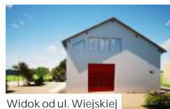
Widok od ul. Wiejskiej

Umowa na wykonanie zadania gmina podpisała w marcu 2020 roku z firmą AGC Bytom Sp. z o.o. Inwestycja powstaje sys-