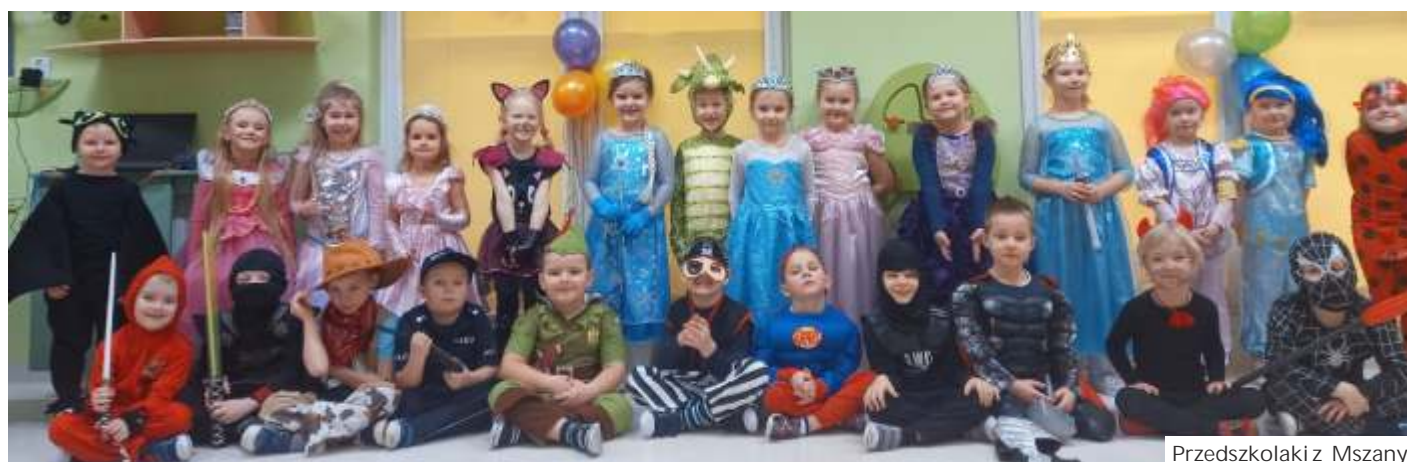
Przedszkolaki z Mszany