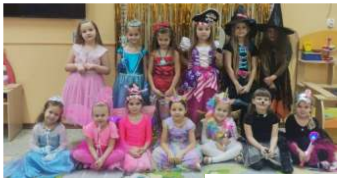
Przedszkolaki z Gogołowej

W pierwszej połowie lutego wychowawcy zorganizowali dla podopiecznych tradycyjne baliki karnawałowe. W przedszkolu w Gogołowej taka impreza odbyła si ju 4 lutego. Dzieci zaprezentowały si w strojach swoich ulubionych postaci z bajek i filmów. Królowały... stu by mundurowe, ponadto motylki, królowny, jednoro ce, piraci... i superbohaterowie. Przedszkolaki otrzymały niespodziank w postaci słodkich upominków ufundowanych przez Rad Rodziców. Najwi ksz niespodziank tego dnia była wizyta gminnej telewizji „TV Mszana” . Przedszkolaki mog si obej-