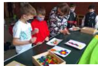
SP w Gogołowej