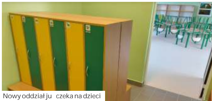
Nowy oddział już czeka na dzieci

W Gogołowej już wszystko jest gotowe na przyjęcie kolejnej grupy przedszkolaków. Miejsce na II oddział wygospodarowano z pomieszczenia SP. Prace remontowe wykonała firma SKID z Pawłowic. I. za kwotę 346,3 tys. zł. Gminie udało się pozyskać środki na wyposażenie