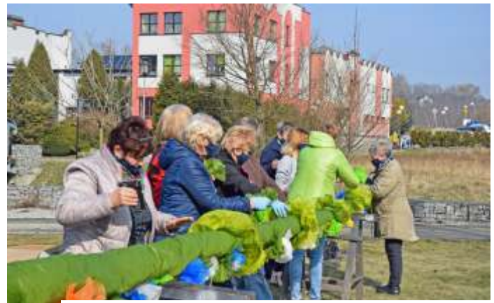
Prace przy ustawianiu gigantycznej palmy w parku - 26 marca