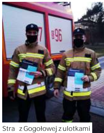
Straz z Gogołowej z ulotkami

Wypełniaj c formularz nale y odpowiedzie m.in. na pytanie, czy miało si bezpo redni kontakt z osob zaka on wirusem SARS-CoV-2, w jakiej odległo ci od niej si przebywało, czy