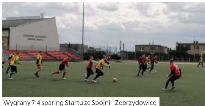
Wygrany 7:4 sparing Startu ze Spójni Zebrzydowice

Ostatecznie w okresie przygotowawczym Płomień rozegrał 5 spotkań kontrolnych, w których odniósł 2 zwycięstwa i zanotował 3 porażki. W rundzie wiosennej skład zespołu wzmocnił: Daniel Chyczewski (przebiegający z Górnika Radlin) i Dawid Piszczek (powrót po kontuzji).