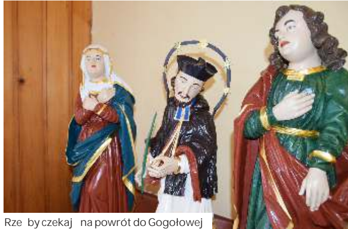
Rze by czekają na powrót do Gogołowej

W XIV wieku w Jan z czeskiego Pomuka jest pierwszym m czennikiem chrze cija skim, zwi zany m z tajemnic spowiedzi. Zgin ł w 1393 roku, zrzucony z mostu do rzeki Wełtawy z polecenia króla czeskiego Wacława IV. Według tradycji, gdy ponad 300 lat po pochówku otwarto krypt , okazało si , e zwłoki wi tego m j nienaruszony j zyk. Przypisuje si to temu, e musiał on znosi tortury z powodu tajemnicy spowiedzi. Cz sto jest przedstawiany z palcem na ustach, z palm i krzy em w dłoni. Wokół jego głowy znajduje si 5 gwiazd, które symbolizuj