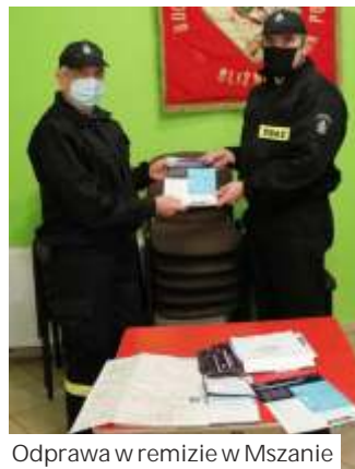
Odprawa w remizie w Mszańcu

Wzrost liczby zachorowa w całym kraju spowodował powrót do nauki zdalnej uczniów klas I - III szkół podstawowych. Najmłodszy uczniowie wrócili przed komputery 22 marca. Pozostałe klasy ucz si zdalnie tak jak do tej pory. Od 27 marca zostały zamkni te tak e przedszkola. Na razie do 9 kwietnia. Zostały tak e zawieszony wszy-