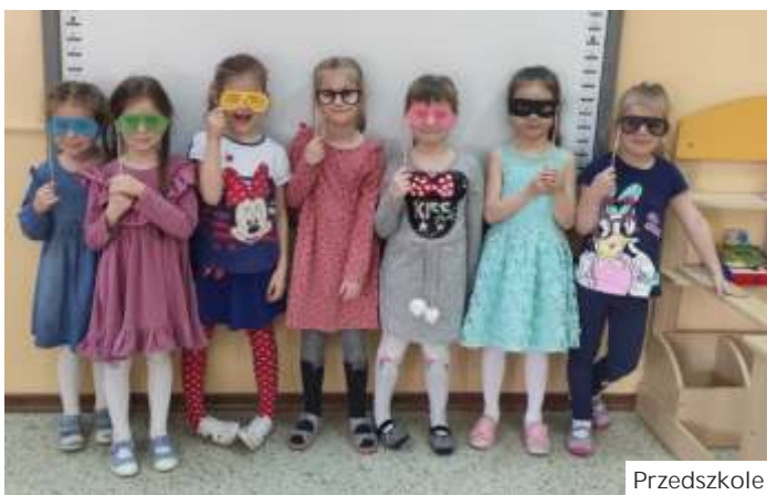
Przedškole w Gogołowej