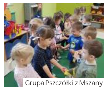
Grupa Pszczółki z Mszany