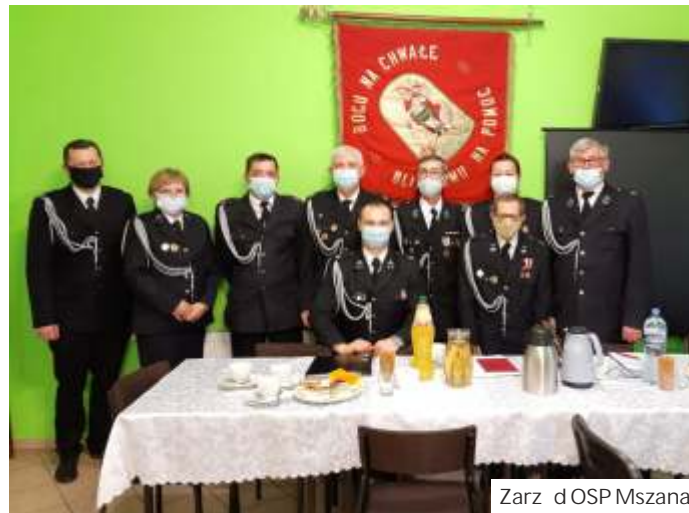
Zarząd OSP Mszana

W Mszanie zebranie sprawozdawczo-wyborcze odbyło się 28 lutego. Zarząd również otrzymał absolutorium, ale ze względu na zdrowotnych z kandydowania na funkcję prezesa zrezygnował wieloletni "szef"