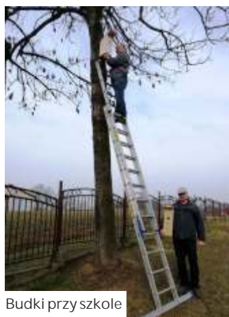
Budki przy szkole

Budki zostały umieszczone na wysokości 3-4 metrów. Miejmy nadzieję, że wkrótce pojawi się w nich skrzydlaci lokatorzy.