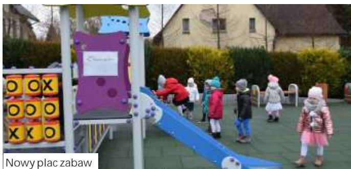
Nowy plac zabaw

topadzie ub. roku kosztował 129 tys. zł. Gmina otrzymała z Fundacji JSW 42,5 tys. zł na