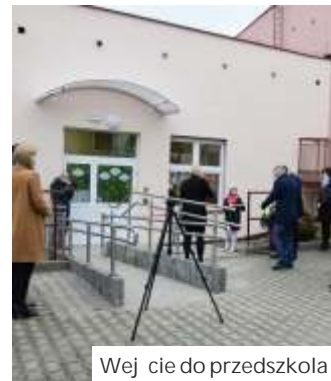
Wej cie do przedszkola