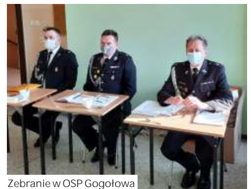
Zebranie w OSP Gogołowa