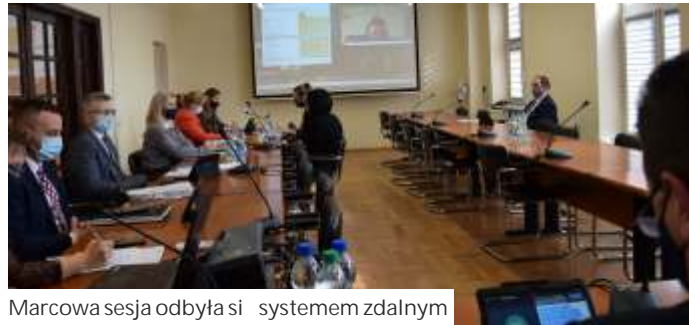
Marcowa sesja odbyła się systemem zdalnym

Podjęto również uchwałę ws. zwolnienia z opłaty za udzielanie