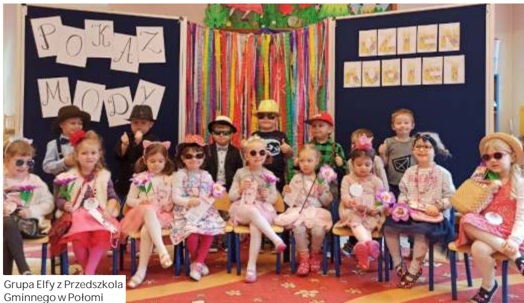
Grupa Elfów z Przedškola Gminnego w Połomi

W innych przedškolach równie Dzie Kobiet był okazj do wr czenia upominków i wspólnej zabawy. Dziewczynki tego dnia czuły si jak królowny.