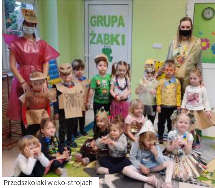
Przedstawiciele w eko-strojach