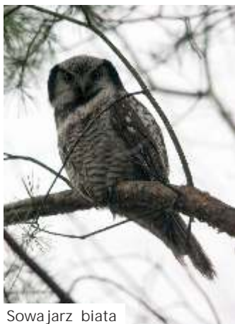
Sowa jarz biata