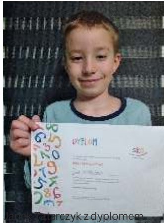
Przebieg z dyplomem

Członkowie Szkolnej Kasy Oszczędnościowej klas I-VI (i nie tylko) w Szkole Podstawowej w Mszanie, przystąpili do testu sprawdzającego poziom wiedzy z zakresu: ekologii, finansów, zdrowego stylu życia oraz cyberbezpieczeństwa. Test był prezentowany na platformie szkolneblogi.pl oraz na stronie banku PKO BP. Każde dziecko odpowiadało na 10 pytań w poszczególnych kategoriach wiekowych.