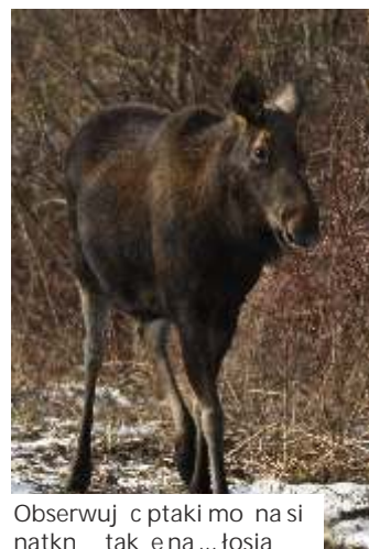
Obserwujcie ptaki mo na si natknę tak e na... łosia

Na emeryturze przyszedł czas, by nareszcie w pełni realizować swoje zainteresowania. Wiele ptaków nie wymaga dalekich wyjazdów, aby je sfotografować. Popularne gatunki mogą nawet przylecieć na podwórko. Z pierwszymi przymrozkami i śniegiem na przełomie roku pasjonat wystartował z "sezonem karmnikowym". W budce meldowały się: sosnowki, bogatki, modraszki, wróble, mazurki, sierpowki, sójki i kosy, gile, jery, a także czeczotki i czeczotki brzoźwe, dzwoneczki, czy też i zięby... dok. na str. obok