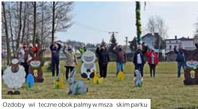
Ozdoby wiosenne obok palmy w mszańskim parku