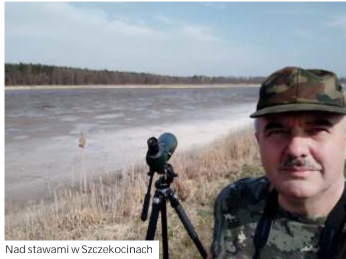
Nad stawami w Szczekocinach