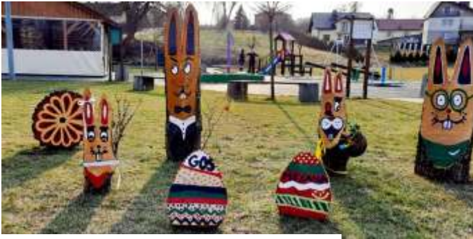
Drewniane ozdoby na skwerze w centrum Połomi

Warto z wdzięcznością wspomnieć o autorach takich inicjatyw, bo przecież takie działania sporo wykraczają poza zwykłe obowiązki służbowe. A potrafi sprawić wiele radości. (mk)