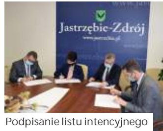
Podpisanie listu intencyjnego

Có to jest ów mechanizm sprawiedliwej transformacji? Ma być kluczowym narzędziem służącym zapewnieniu tego, by