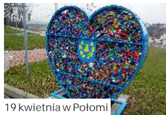
19 kwietnia w Połomi

szkole" zapełnił si błyskawicznie i już musiał by po raz pierwszy opró niony. Okazał si całkiem pojemny - zebrano osiem worków nakr tek. (mk)