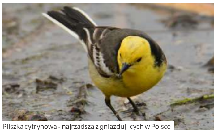
Pliszka cytrynowa - najrzadsza z gniazdujących w Polsce

dok. ze str. obok... Całe za to drobne towarzystwo regularnie przeganiała para krogulców.