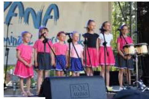
„Wej ciówka do lata” - pierwsza impreza plenerowa GOKiR po lockdownie