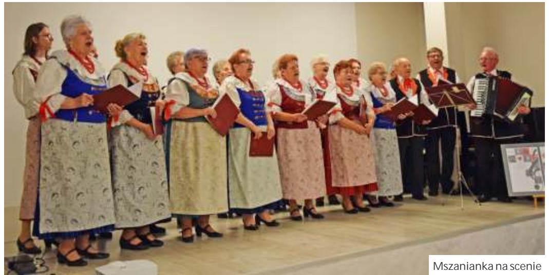
Mszanianka na scenie

9 czerwca jubileusz 35-lecia działalności i wi tował Zespół piewaczy MSZANIANKA. To jeden z najbardziej rozpoznawalnych elementów dziedzictwa kulturowego naszej gminy.