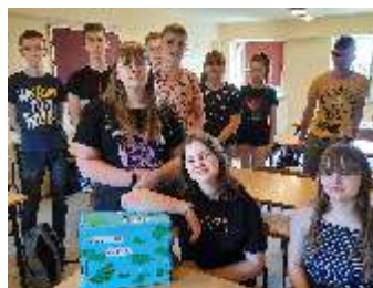
Organizator zbiórki - klasa VIII

Akcja "Adopcja Serca", prowadzona przez kl. VIII Szkoły Podstawowej w Połomi pobiła kolejny rekord w sumie zebranych pieniędzy. Po długim okresie nauki zdalnej dzieci ze szkoły i przedszkola pokazały, e wci pami taj , co to znaczy pomaga .