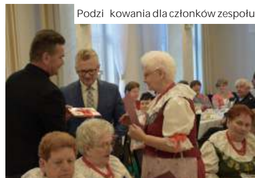
Podzi kowania dla członków zespołu

Drug metod gromadzenia pie ni było odwiedzanie starszych mieszkań ców Mszany