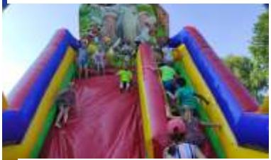
Atrakcje ufundowane przez Rad Rodziców SP w Gogołowej