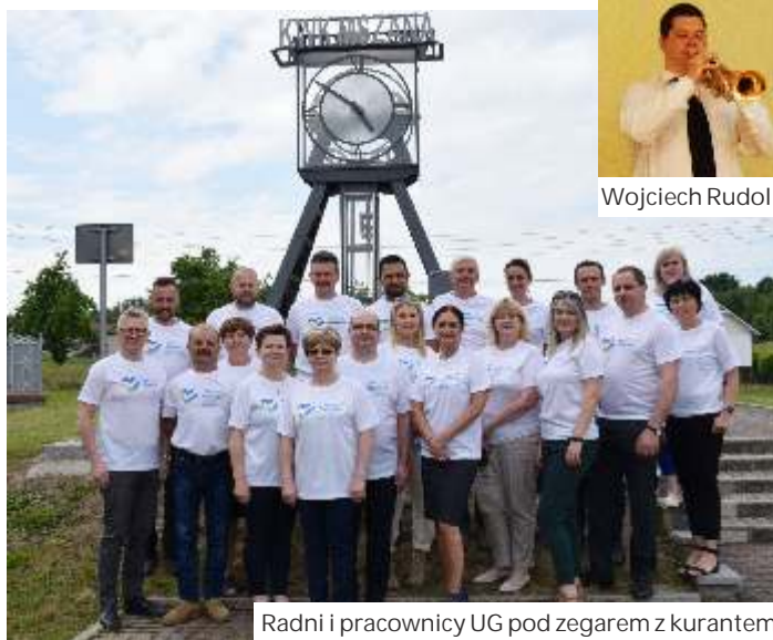
Radni i pracownicy UG pod zegarem z kurantem

Hejnał został opracowany na podstawie zrekonstruowanej XV-wiecznej antyfony "Gloriose Rex Oswalde", zamieszczonej na pergaminowej karcie wydobyczej z okładki zabytkowej księgi parafialnej z Mszy. Jest to liść, aby jakiegoś wydarzenia, a takim było odkrycie tej karty w starej księdze, wykorzystano promocyjnie, należy to robić. Już podczas prezentacji zrekonstruowanej an-