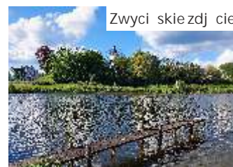
Zwyci skie zdj cie