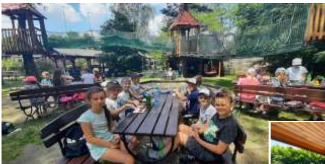
Wycieczka do Rud młodszych uczniów SP w Mszanie