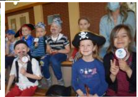
Lizaki na Dzie Dziecka z Urz du Gminy