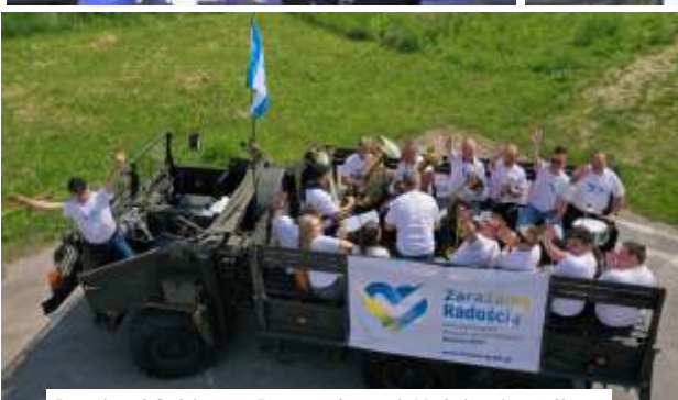
Gminny Rajd Rowerowy