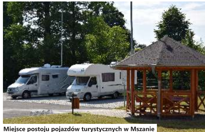
Miejsce postoju pojazdów turystycznych w Mszanie

„Kamperownia” zlokalizowana jest kilometr od zjazdu z autostrady A1. Prowadzą do niego specjalne oznakowania. Na turystów podróżujących kamperami czeka tu wygodny, dobrze oświetlony parking z dostępem do podładowania elektrycznego i miejscem zrzutu cieków oraz wygodnymi altankami.