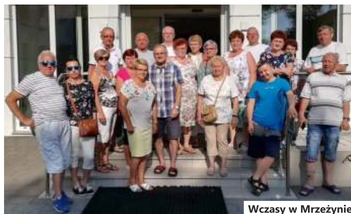
Wczasy w Mrzeżynie

jedzenie pyszne, a pogoda była dodatkową atrakcją: przeżądka ciuchci, wieczór włoski,