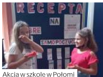
Akcja w szkole w Połomi

Samorz d uczniowski SP w Połomi wzi ł na siebie zadanie przygotowania "Apteczki pomocy emocjonalnej", w ramach, której uczniowie – uczniom doradzali, jak radzi sobie z powrotem do szkoły i relacjami z kolegami po półrocznym lockdownie. - Członkowie samo-