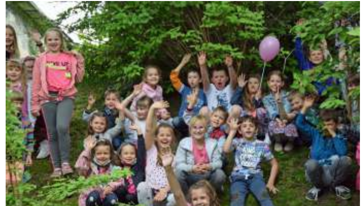
„Wyci gamy dzieci z sieci” - Polana Kultury w Połomi

Od pocz tku czerwca mieszka cy mog korzysta tak e z darmowych zaj rekreacyjnych: fitness przed południem, nordic walking, zumbi i aerobiku (szczegóły na stronach GOS i GOKiR). (mk)