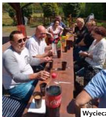
Wycieczka w Wiśle

Dla spragnionych dłużej wypoczynku zorganizowano wczasy nad morzem. W dniach od 13 do 25 czerwca grupa 22 seniorów odpoczywała w Mrzeżynie, w pięknym Domu Wczasowym „Koral”. Warunki mieszkaniowe były wyśmienite,