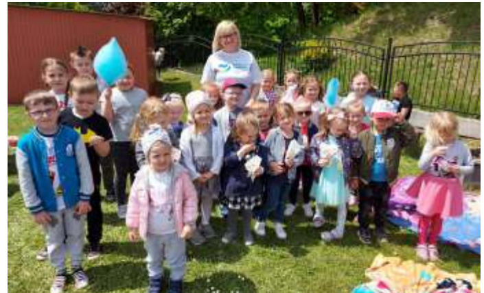
Dzie Dziecka w gogołowskiej szkole i przedszkolu