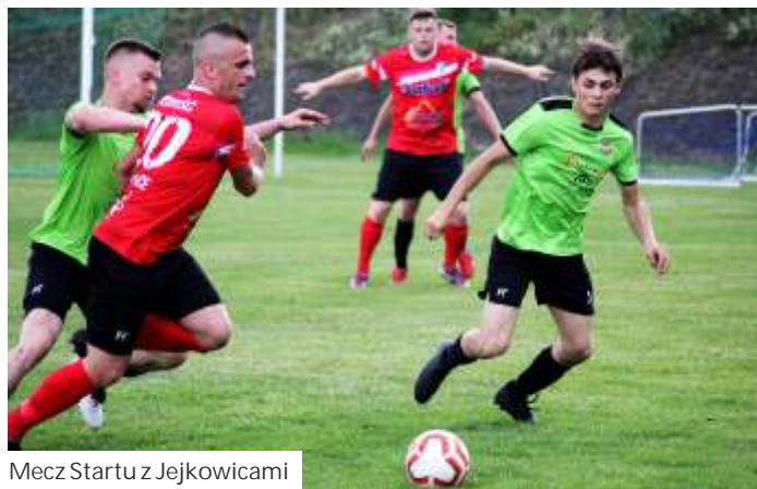
Mecz Startu z Jejkowicami