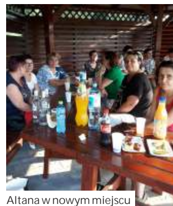
Altana w nowym miejscu

Po długim okresie lockdownu panie z Koła Gospody Wiejskich w Gogołowej mogły nareszcie spotkać się w większym gronie. Zorganizowały wieczór przy grillu w altanie sołeckiej,