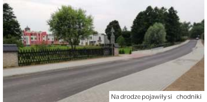
Na drodze pojawiły się chodniki

Ulica Tuskera w centrum Mszany łączy powiatowe ul. 1 Maja z drogą gminną - ul. Mickiewicza. To ważny trakt komunikacyjny prowadzący do kościoła, cmentarza i terenu Gminnego Ośrodka Kultury i Rekreacji. Największym wyzwaniem w trakcie inwestycji była przebudowa mostku nad Mszanką. Stary był w fatalnym stanie technicznym. Oprócz przebudowy przepustu