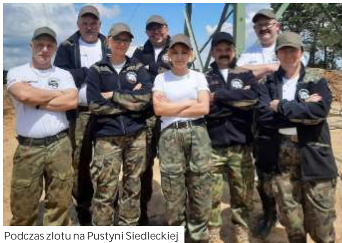
Podczas zlotu na Pustyni Siedleckiej

- Zaczynali my od małych pokazów na festynach, odtwarza-nia niewielkich potyczek. Dzi spotykamy si tak e na auten-tycznych poligonach wojsko-wych, gdzie odbywaj si ma-newry, wiczenia pokazowe i rekonstrukcje, w których jed-nocze nie bierze udział wiele grup. Ka da odtwarza co innego, ponadto jest współ-działanie z pirotechnikami, eby to dobrze, jak najbardziej