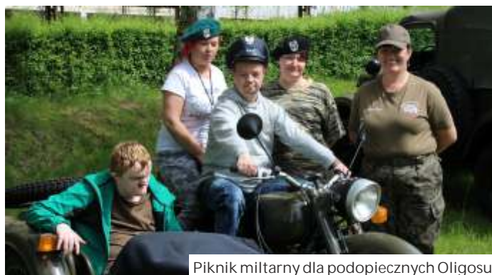
Piknik militarny dla podopiecznych Oligos