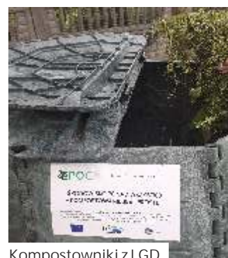
Kompostowniki z LGD

Kontynuujemy uwiadomianie w zakresie gospodarowania energią, poprzez gry i zabawy adresowane do dzieci, młodzieży i starszych w tzw. miasteczkach energii. Posiadamy również różnorodne interaktywne instalacje edukacyjne oraz stanowiska