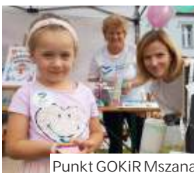
Punkt GOKiR Mszana