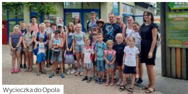
Wycieczka do Opola