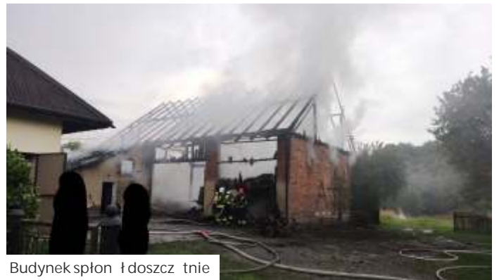
Budynek spłonął doszczętnie

Od uderzenia pioruna w czasie burzy, 17 lipca, zapaliła się stodoła w Połomi na ul. Centralnej. Na miejscu pracowało 8 zastępów straży pożarnej. Niestety budynek doszczętnie spłonął. Na szczęście nie było ofiar wśród zwierząt ani osób poszkodowanych. Dzięki sprawnym działaniom straży pożarnej nie przeżył na szczęście zabudowania. Właściciele szacują stra-