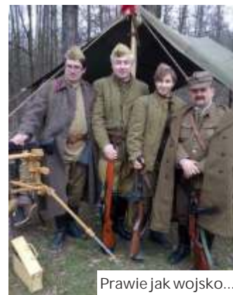
Prawie jak wojsko...

- Te wspólne spotkania to naj-wi ksza warto naszej pasji. Przez kilka dni jeste my w innym wicie, daleko od spraw dnia powszedniego. Mieszkamy w obozowisku, pimy w nami-otach wojskowych, rozpalamy ogniska, ywimy si w kuchni polowej, mamy nawet własnego kucharza - opowiada Goik. Spotkania te maj swój rytuał. Ka dy nosi koszulk z logo grupy i własn ksywk , zale n