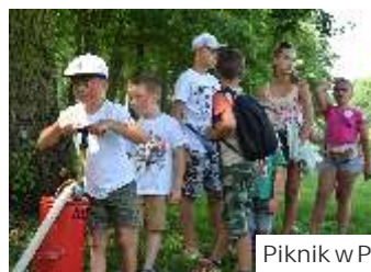
Piknik w Parku w Mszanie