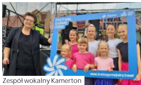
Zespół wokalny Kamerton

Impreza zorganizowana przez rodzki kultury z całego powiatu pod patronatem Starostwa Powiatowego w Wodzisławiu Śląskim, była dofinansowana z Subregionu Zachodniego Województwa Śląskiego. (rj)