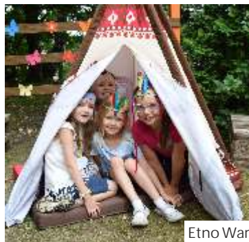
Etno Warsztaty na Polanie Kultury