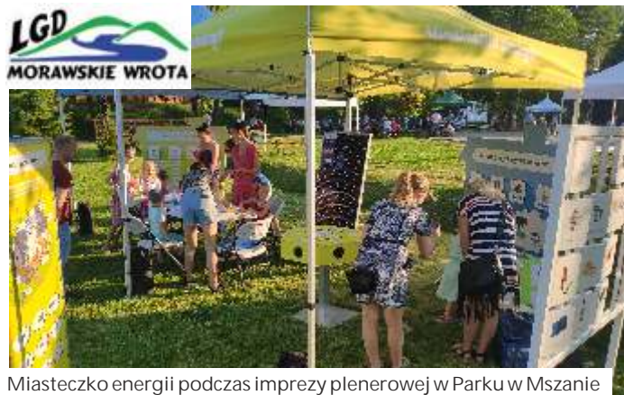
Miasteczko energii podczas imprezy plenerowej w Parku w Mszanie

Dzieje się wiele również w drugim projekcie „Współpraca-integracja-rywalizacja”. I tutaj już została się odbyła, a pozostałe są w trakcie realizacji. Projekty te realizują