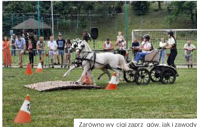
Zarówno wyścigi zaprzęgów, jak i zawody ujeżdżeniowe były bardzo widowiskowe