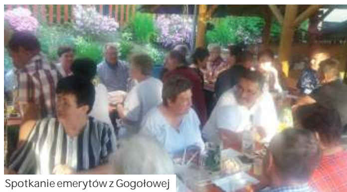
Spotkanie emerytów z Gogołowej