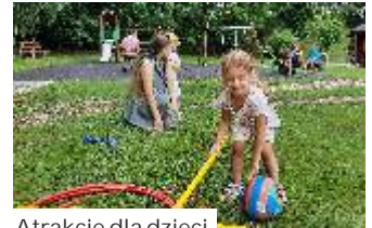
Atrakcje dla dzieci