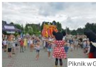
Piknik w Gogołowej