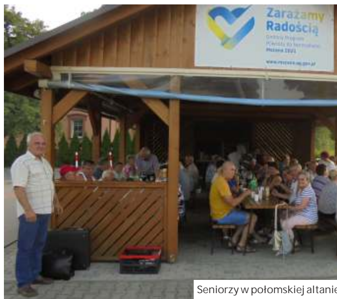
Seniorzy w połomskiej altanie