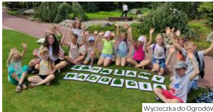
Wycieczka do Ogrodów Kapias

Orodek Sportu zaprasza także na bezpłatne zajęcia fitness i nordic walking. 22 lipca w wycieczkach w Połomiu wzięli także udział podopieczni Orodka Wsparcia Caritas. (mk)