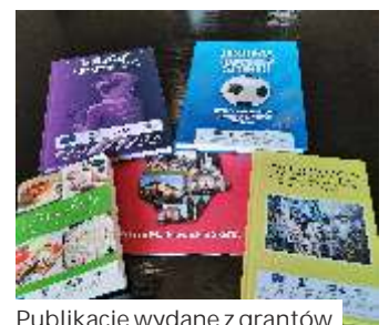
Publikacje wydane z grantów

Tematy ekologiczne oraz wykorzystania lokalnych zasobów także turystycznych zdominowały nasz wyjazd, bo oprócz Bioelektro zwiedzaliśmy jedyny w Polsce zakład przechowywania odpadów radioaktywnych, poznaliśmy też Forty w Róźnie oraz fantastyczny Ziołowy Zakątek w Korycinach (woj. podlaskie). Wyjątkowa atmosfera, wzajemne poznawanie się i tzw. sieciowanie - wymiana poglądów... dok. na str. 7