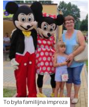
To była rodzinna impreza

Pomimo niepewnej aury udało się szczęśliwie przeprowadzić zawody oraz wszystkie zaplanowane atrakcje. (aa)