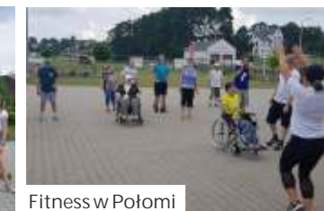
Fitness w Połomiu