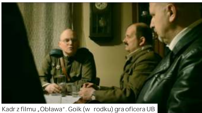
Kadr z filmu „Obława”. Goik (w rodku) gra oficera UB

- Ruch uwalnia adrenalin . Podobnie jak jazda transpor-terem, ale jest du o ta szy -mieje si miło nik wojsko-wych pojazdów, z których ka -dy pali 40 - 50 l/100 km. (mk)