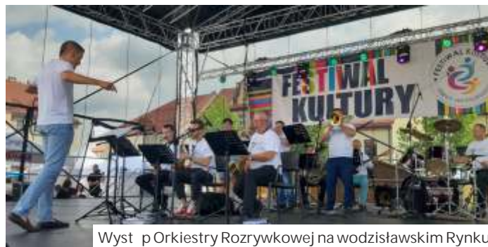
Występ Orkiestry Rozrywkowej na wodzisławskim Rynku

GOKiR w Mszanie był, wraz z Orodkiem Kultury w Lubomi, koordynatorem stoisk i animacji