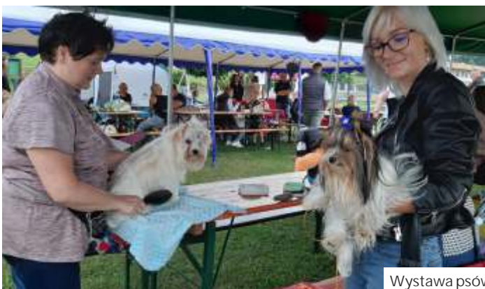
Wystawa psów rasowych w Połomi