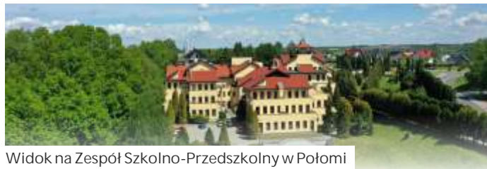
Widok na Zespół Szkolno-Przedszkolny w Połomi

Do Zespołu Szkolno-Przedszkolnego w Połomi od 1 września pójdzie 382 dzieci, w tym: 245 uczniów SP w 14 oddziałach oraz 137 przedszkolaków w 6 oddziałach. W Zespole łącznie zatrudnionych jest 38 nauczycieli, a także pedagog, psycho-