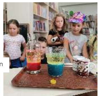
Wakacje w Gogołowej z Bibliotek Gminnych