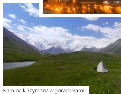
Namiocik Szymona w górach Pamir