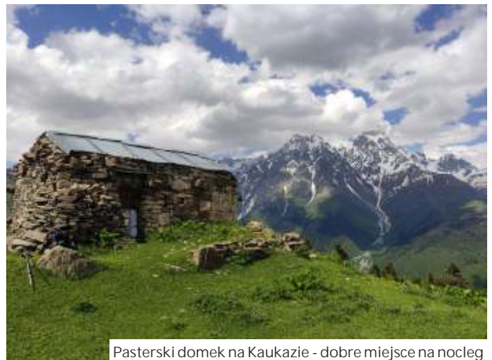
Pasterski domek na Kaukazie - dobre miejsce na nocleg