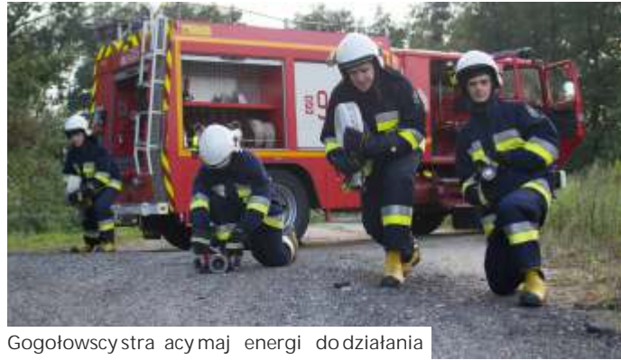
Gogołowscy strażacy mają energię do działania

– W OSP zawsze jest coś potrzebne, zawsze znajdują się nowe wydatki. Ponadto zmieniają się przepisy nakładające na nas nowe obowiązki, a to oznacza nowe koszty. To samo dotyczy naszego sprzętu, im nowocześniejszy, tym droższy w utrzymaniu, ale też skuteczniejszy w akcji. Dlatego szukamy dodatkowych pieniędzy z każdego możliwego źródła. Fundacja jest dla nas idealnym partnerem do współpracy, choć trzeba by