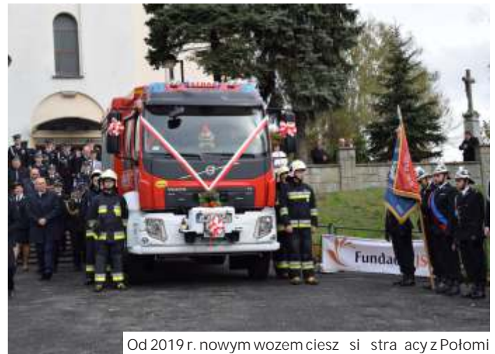
Od 2019 r. nowym wozem cieszą się strażacy z Połomia