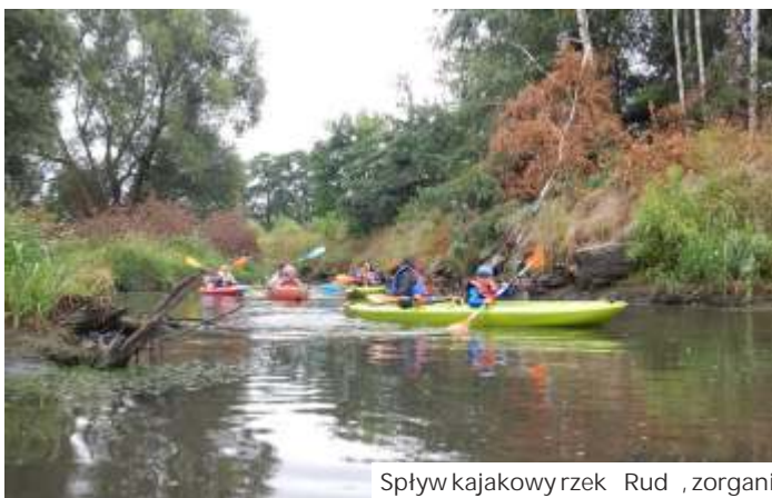
Spływ kajakowy rzeką Rud, zorganizowany przez GOS Mszana