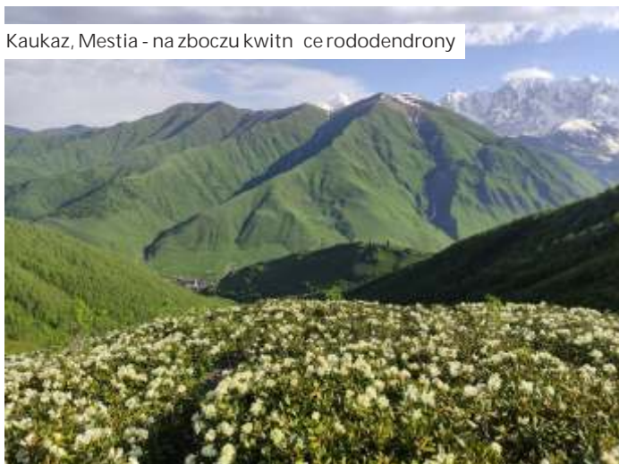
Kaukaz, Mestia - na zboczu kwitnące rododendrony

We wrześniu 2020, po 2 latach spędzonych na antypodach, Szymon Tront... dok. na str. obok