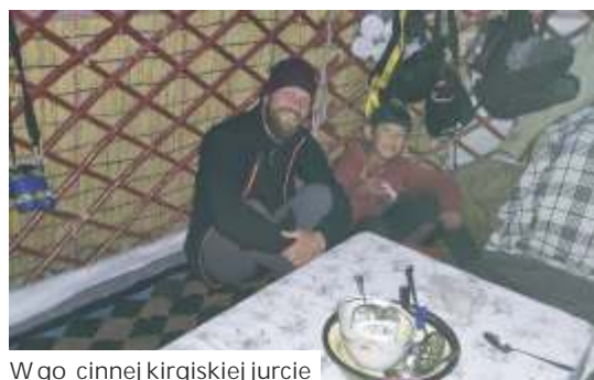
W go cinnej kirgiskiej jurcie