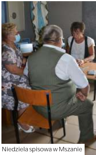
Niedziela spisowa w Mszanie

Codziennie, w godzinach urzędowania, czynne jest ponadto