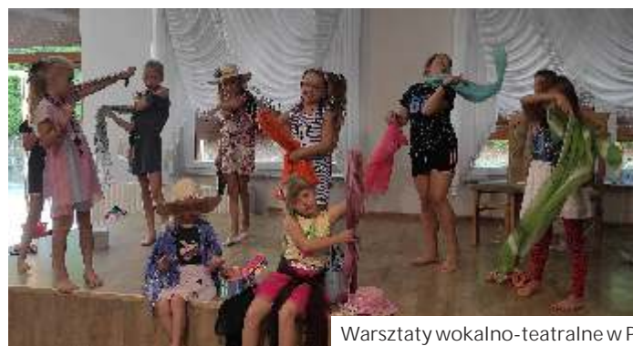
Warsztaty wokalne-teatralne w Połomi. Organizator: GOKiR Mszana