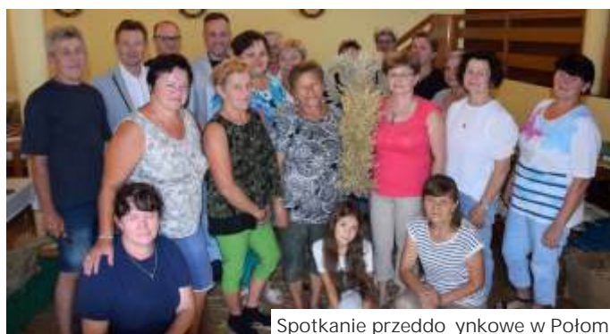
Spotkanie przed dożynkami w Połomi

Rada Sołectwa w Mszanie również ma już gotowe korony i ozdoby na Mszanę. Do dożnek 14 września. Pani Sołtys dziękuje wszystkim zaangażowanym w ich przygotowanie.