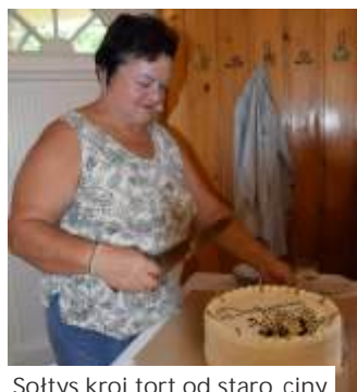
Sołtys kroi tort od starosty