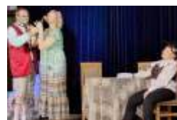
Na scenie wa na była zarówno gra aktorów, jak i muzyka