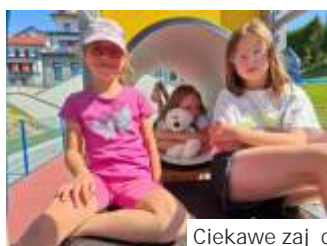
Ciekawe zajęcia odbywały się i w plenerze i w sali