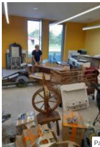
Panie z KGW porządkują stare sprzęty

- Wiadomo, że nie będzie taka sama jak poprzednia, o której mamy i do dziś z wielkim sentymentem. Część starych mebli jest zniszczona, niektóre wymagają malowania. Czekamy na wałek do pomalowania ścian. Na ile będzie to możliwe, chcemy, aby nowa Izba upodobniła się do starej. Sprzętów mamy sporo, chyba żeby ktoś miał być w bardzo dobrym stanie, to