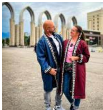
Almaty - miasto i Sobór Wniebowstąpienia Pańskiego

Po dwóch tygodniach pobytu w Kazachstanie, przepakowali bagaż, zostawiając połowę swojego dobytku u gościnnych gospodarzy i ruszyli w dalszą drogę, do Kirgistanu. Ten gorzyski kraj nie jest tak rozwinięty jak Kazachstan, ludzie tutaj biedniejsi, w miastach wciąż widać postkomunizm, infrastruktura nie jest rozwinięta, ale tereny piękne, a ludzie otwarci i gościnni.