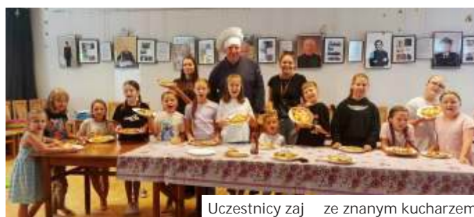
Uczestnicy zajęć z znanym kucharzem