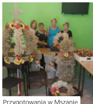
Przygotowania w Mszanie