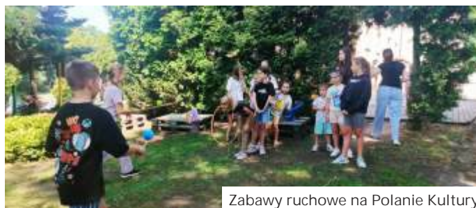
Zabawy ruchowe na Polanie Kultury