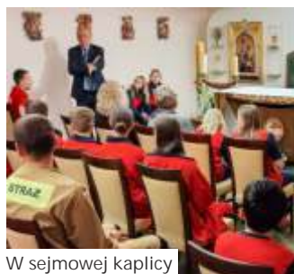
W sejmowej kaplicy