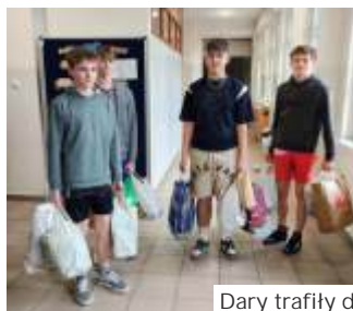
Dary trafiły do Ośrodka prowadzonego przez Caritas