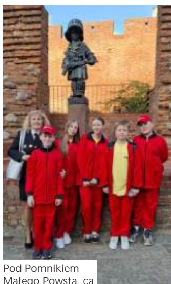
Pod Pomnikiem Małego Powstańcy