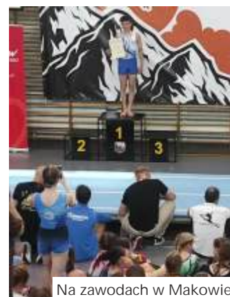
Na zawodach w Makowie