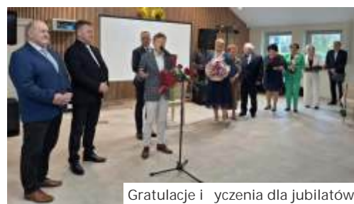
Gratulacje i życzenia dla jubilatów