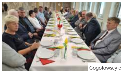
Gogołowscy emeryci nareszcie na swoim