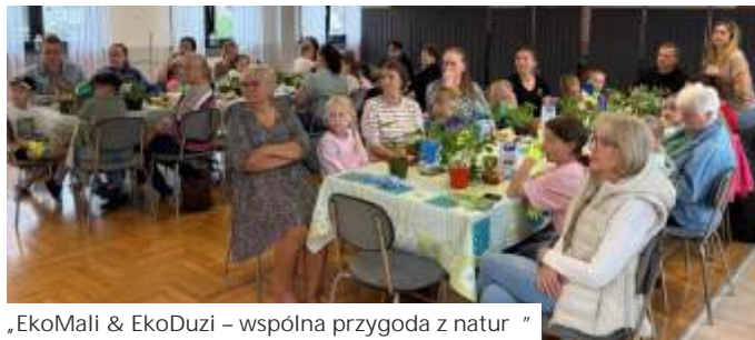
„EkoMali & EkoDuży – wspólna przygoda z naturą”

W nadchodzącym czasie LGD „Morawskie Wrota” planuje ogłoszenie kolejnych naborów wniosków o dofinansowanie, m.in. z zakresu małej infrastruktury publicznej oraz rozwoju i podejmowania działalności gospodarczej. Planowane działania mają na celu wspieranie inwestycji poprawiających jakość życia mieszkańców, rozwój