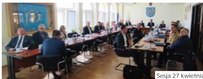
Sesja 27 kwietnia

Ilość wypadków drogowych spadła z 4 w 2024 do 3 w 2025. Analizując zdarzenia drogowe policjanci wytypowali na terenie gminy 3 miejsca zagrożone: ul. Wodzisławska - 33 kolizje, ul. Wolności - 15 kolizji i odcinek autostrady A1 - 20 kolizji i 1 wypadek. Odnotowano te 2 wypadki: na ul. 1 Maja i ul. Chabrowej w Mszanie. Naniesiono 54 zgłoszenia na internetowej Krajowej Mapie Zagrożeń. Najczęściej zgłaszano: przekroczenie prędkości (13), dzikie wysypiska (mieczi