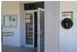
Defibrylator na basenie w Połomi

Defibrylator to urządzenie służące do przywrócenia pra-