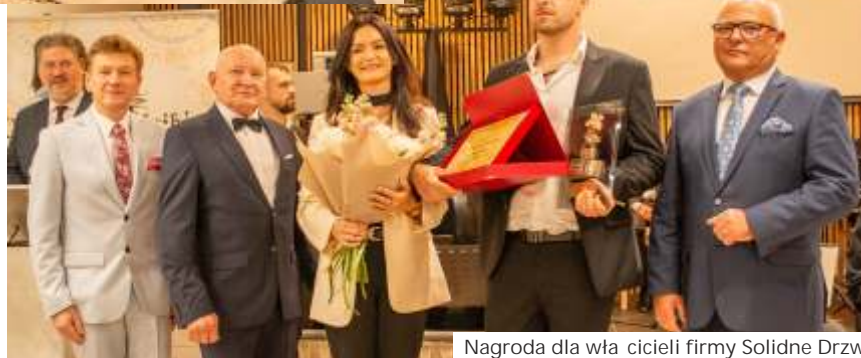
Nagroda dla włacicieli firmy Solidne Drzwi