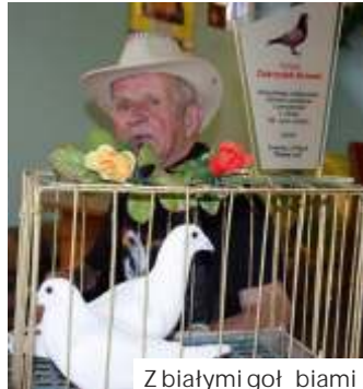
Z białymi gołbiami

O pozytywnie zakończonym pasjonacie już teraz wielu pamięta.