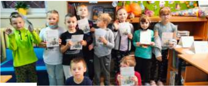
Klasy Ia i Ib

biblioteki, uczniowie uczestniczyli w zajęciach, podczas których przyrzekli szanować księżki i często przychodzić do biblioteki. Na pamiątkę pasowania uczniowie otrzymali dyplomy oraz drobne niespodzianki. (mw)