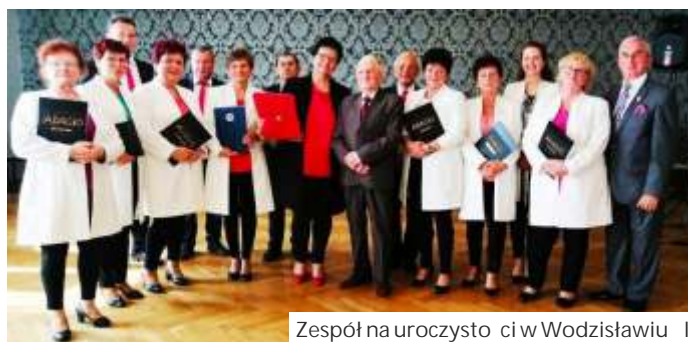
Zespół na uroczystości w Wodzisławiu I.

Zarząd Główny Polskiego Związku Emerytów, Rencistów i Inwalidów w uznaniu wybitnych zasług dla Związku, nadał Złotą Odznakę Honorową zespołowi wokalnemu-muzycznemu Adagio z Gogołowej. Uroczystość prze-