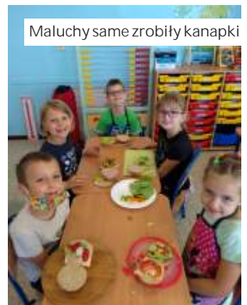
Małuchy same zrobiły kanapki

Edukacja zdrowotna jest ważnym aspektem wychowania, dzieci od najmłodszych lat nabywają właściwe nawyki żywieniowe.