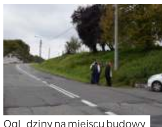
Oglądanie dziny na miejscu budowy

Wykonawcą inwestycji będzie firma Szczyrba s.c. z Rogowa. Inwestorem jest Powiat Wo-