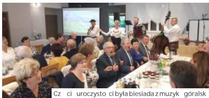
Członek uroczystość była biesiada z muzyką górską