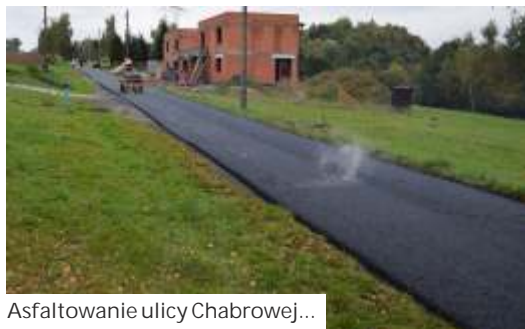
Asfaltowanie ulicy Chabrowej...

Trwają remonty nawierzchni kilkunastu odcinków dróg gminnych w Mszanie, Połomi i Gogołowej. Nowe nakładki asfaltowe zostały już położone na ulicy Chabrowej (od ul. 1 Maja do nr 5 k) i na Konopnickiej (odcinek od ul. 1 Maja do Mszanki) w Mszanie.