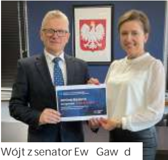
Wójt z senator Ewą Gawdzisz

Nasza gmina otrzymała w pierwszym rozdaniu z Rządowego Funduszu Polski Ład - Programu Inwestycji Strategicznych 4,7 mln złotych. To rodki pozyskane na konkretny projekt: remont ciągu komunikacyjnego dróg gminnych w sołectwie Mszana (od ul. Kopernika po zachodniej stronie gminy do końca Mickiewicza po stronie wschodniej). - Bardzo dziękuję pani Senator Ewie Gawdzisz za pomoc i wsparcie w pozyskaniu tych rodków - mówi wójt Mirosław Szymanek.