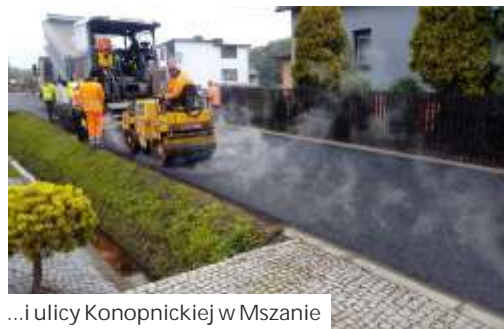
...i ulicy Konopnickiej w Mszanie

Trwają roboty w Połomi na odnodze ulicy Szkolnej (do krzyżu a i od nr 9 do przepustu). Wyremontowany będzie ten odcinek bocznej ul. Wolności (za lakiernią), boczna ul. Centralnej (od nr 127 a do 131 a), łącznik Centralna – Przyległa i boczna ul. Centralnej (w kierunku nr 79 f).