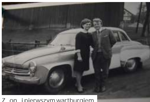
Z żoną i pierwszym wartburgiem

Najdalej na tej maszynie był krótko po jej zakupie, w Katyniu, na międzynarodowym rajdzie motocyklowym, by oddać hołd pomordowanym polskim żołnierzom. Jeździli tam trzy dni, ... dok. na str. obok