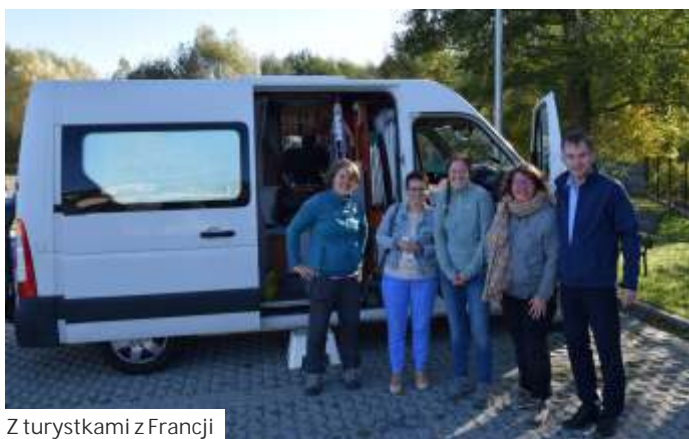
Z turystkami z Francji

Warto dodać, że na naszym postoju parkowały już także kampery z Austrii, Włoch i dalekiej Portugalii. (mk)