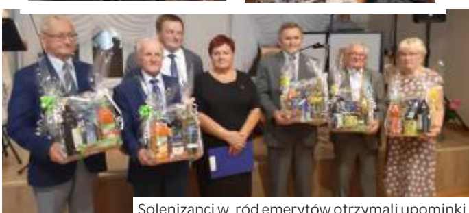
Solenizanci w ród emerytów otrzymali upominki