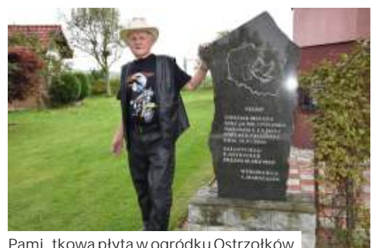
Pamiętnikowa płyta w ogródku Ostrzołków