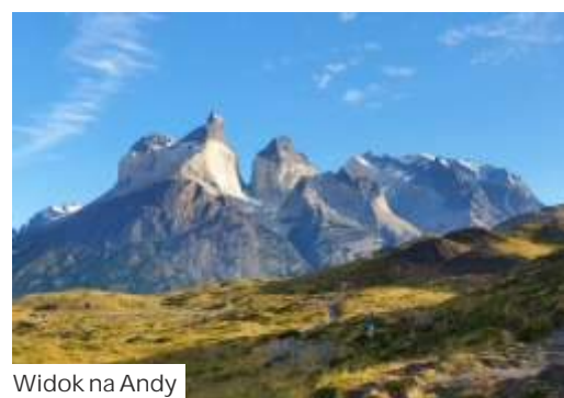
Widok na Andy