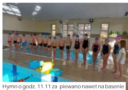
Hymn o godz. 11.11 za piewano nawet na basenie