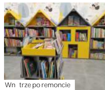
Wnętrze po remoncie