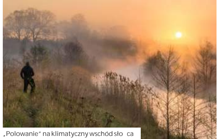
„Polowanie” na klimatyczny wschód słońca

Nie ukrywa, że pasje to jego odskocznia i forma terapii w problemach zdrowotnych. We wczesnej młodości przeżył wypadek samochodowy, potem zachorował na depresję. Były okresy, że było z nim ciężko, teraz powoli wychodzi na prostą. Wciąż musi być jednak pod opieką lekarską i psychologiczną. Zależy mu, żeby o depresji mówił otwarcie i rzetelnie. I żeby uważnym na ludzi o podobnej chorobie dotykał najczęściej.