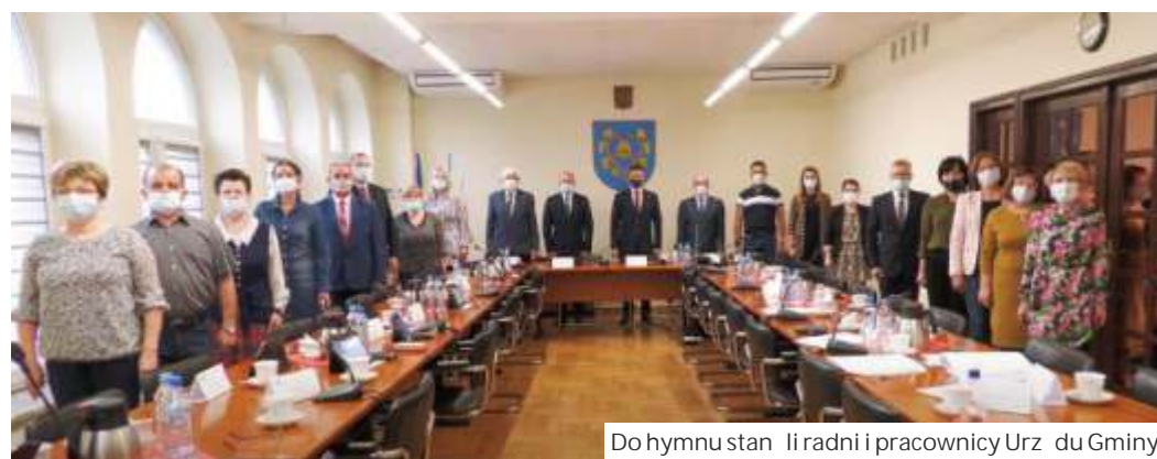
Do hymnu stan li radni i pracownicy Urz du Gminy