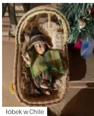
lóbek w Chile