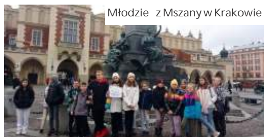
Młodzież z Mszany w Krakowie