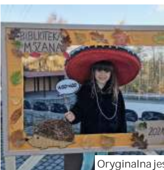
Oryginalna jesienna fotobudka