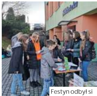
Festyn odbył się na placu przed biblioteką

Bibliotekarze przygotowali także ciekawe konkursy i zadania, było malowanie twarzy, fantazyjne fryzury i oryginalna foto-budka. - Jak na bibliotek przystało, było też mnóstwo wypożyczeń i nowych, małych czytelników, co nas ogromnie cieszy! Dziękujemy za wspólnie