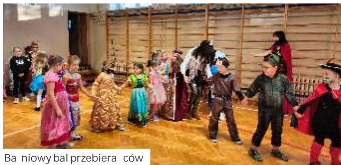
Bańowy bal przebierańców

Następny był bańowy konkurs artystyczny na postać bań lub legendy, w którym uczniowie mieli za zadanie