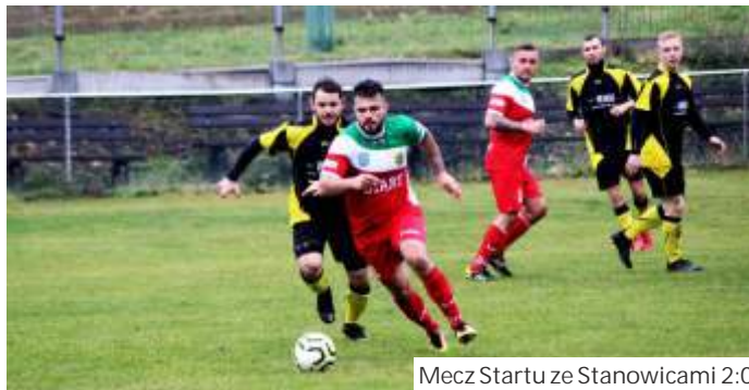
Mecz Startu ze Stanowicami 2:0