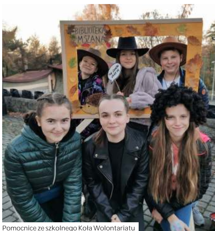
Pomocnice ze szkolnego Koła Wolontariatu