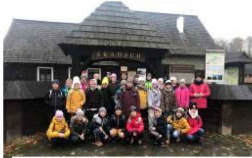
Uczniowie z Połomi przed skansenem w Pszczynie

17 listopada uczniowie klas IV-VIII z Gogołowej zwiedzali gliwicką radiostację i park sen-