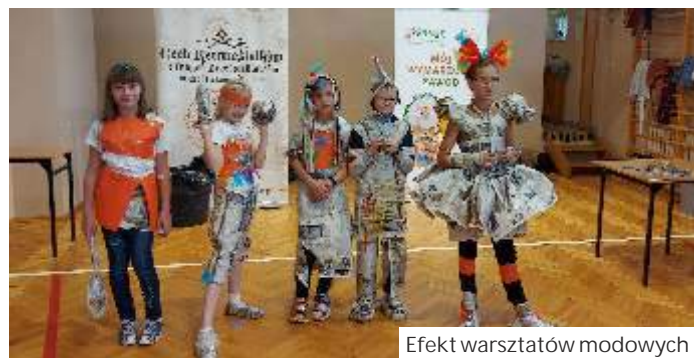
Efekt warsztatów modowych

Koło SKO patronuje także konkursowi na kartki bożonarodzeniowe z elementami o oszczędzaniu. (mc)