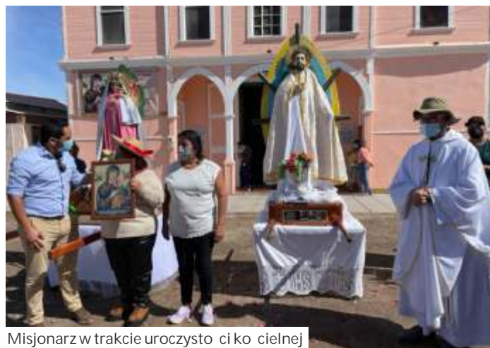
Misjonarz w trakcie uroczystości kościelnej

posługuje w parafii, ale udało mu się także zwiedzić większość kraju, a także pobliskie Peru, Argentynę i Boliwię. Był na Machu Picchu, przemierzał Andy, oglądał lodowce górskie i pingwiny na południowych krańcach Chile, które leżą w klimacie podbiegunowym.