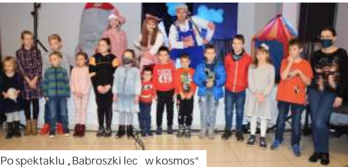
Po spektaklu „Babroszki lecą w kosmos”

Gminny Ośrodek Kultury i Rekreacji w Mszanie ruszył z cyklem dla dzieci „Teatralne soboty”.