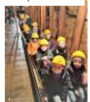
Klasy z Mszany w kopalni srebra