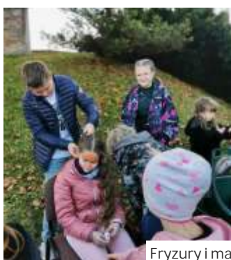
Fryzury i malowanie twarzy