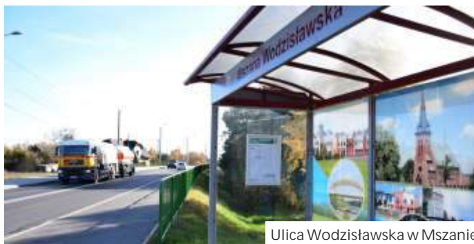
Ulica Wodzisławska w Mszanie

Apeluje więc gdzieś o jak najszybszy remont drogi wojewódzkiej, zwłaszcza że ruch na