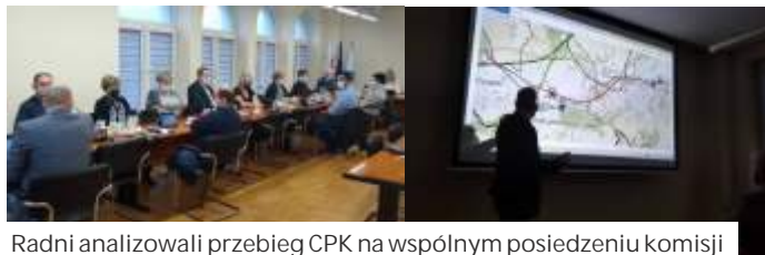
Radni analizowali przebieg CPK na wspólnym posiedzeniu komisji

62A, 64, 64A. CPK zwraca się do mieszkańców gmin, na których terenie zlokalizowana jest planowana inwestycja o zapoznanie z zakresem planowanych przebiegów oraz o wypełnienie ankiety. Link do ankiety znajdu-