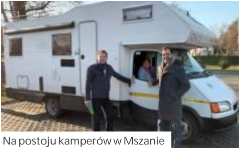
Na postojach kamperów w Mszanie

Po zwiedzeniu Mszany turyści pojechali do Austrii, gdzie zwiedzili Wiedeń, potem chcieli dotrzeć do Włoch, by zwiedzić Rzym i Pompeje oraz miasteczko Pistoia z brazylijskim cmentarzem wojennym. (mr)