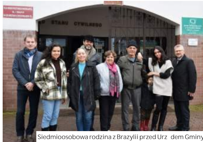
Siedmioosobowa rodzina z Brazylii przed Urzędem Gminy