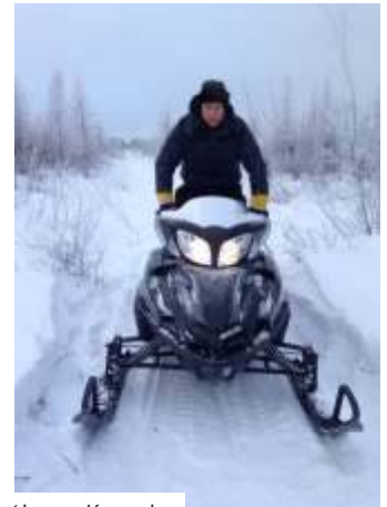
Obrazki z jazdy na dalekiej północy Kanady