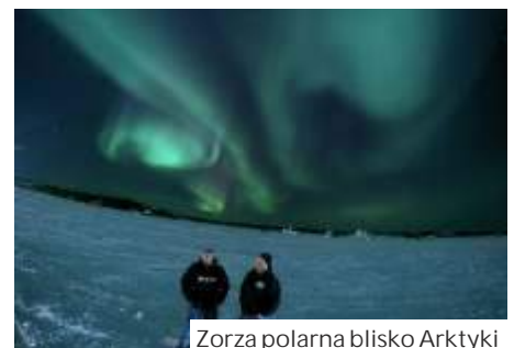
Zorza polarna blisko Arktyki