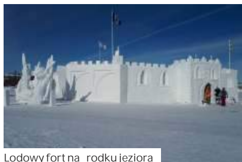
Lodowy fort na rodku jeziora