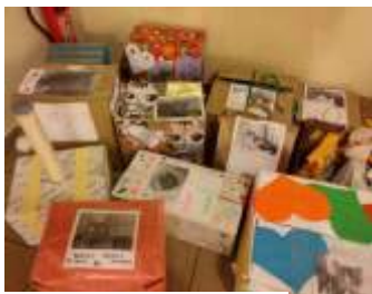
Dary pięknie opakowano

Po raz kolejny uczniowie Szkoły Podstawowej i Gminnego