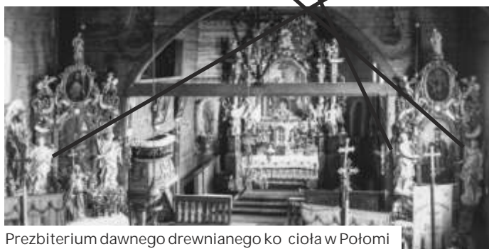
Prezbiterium dawnego drewnianego kościoła w Połomi

rozebrano i w 1979 roku przeniesiono do Wisły Głębokiej.