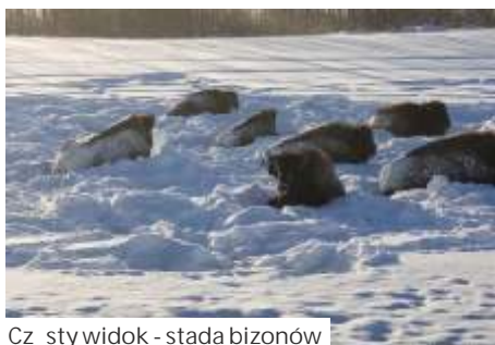
Cz sty widok - stada bizonów

- Zało enie ła cuchów na obie osie i na przyczep zajmowało mi rednio pół godziny. A do czasu, gdy na Alasce, stoj c na poboczu blisko lasu, poczułem na plecach wzrok wilków, które obserwowały mnie zza krzaków. Uporałem si wtedy z robot błyskawicznie, w 10 minut.