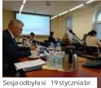
Sesja odbyła si 19 stycznia br.