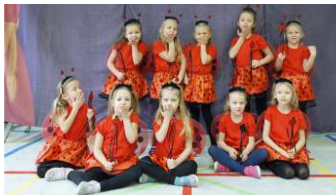
Dziewczynki i chłopcy z grupy Biedronki