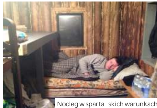
Nocleg w spartanskich warunkach

Raz, z powodu złych oznaczeń, zgubił się w dzikich górach. W nim było na półtora metra. Wisiał już nad przepaścią, miał ciężką nadzieję, że wyjdzie cało z opresji. Choćby wysiadł z samochodu, było za daleko, żeby pieszo dotarł do miejsca, gdzie