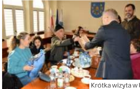
Krótką wizytą w UG i u pasjonata militariów