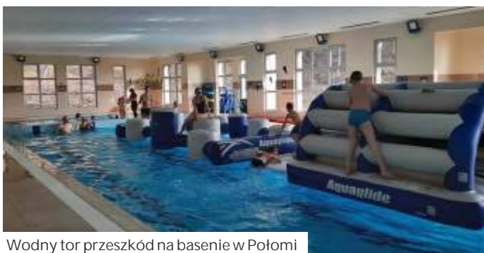
Wodny tor przeszkód na basenie w Połomi