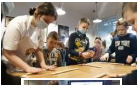
Wycieczka do Krakowa - Rynek, Centrum Nauki Zmysłów i ywe Muzeum Obwarzanka