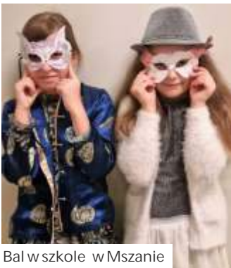
Bal w szkole w Mszanie

Luty to czas balików karnawalowych dla dzieci. Takie zabawy odbyły się w naszych przedszkolach, w młodszych klasach szkół podstawowych (jeszcze przed feriami), po raz pierwszy bal przebiera ców zorganizowała również parafia w Mszanie, w swojej wietlicy parafialnej. Zobaczcie, jak bawiły się dzieci. (mr)