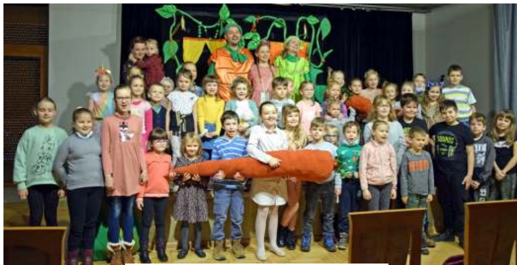
Spotkanie z teatrem i warsztaty artystyczne w GOKiR