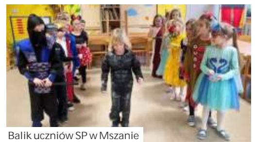
Baliki uczniów SP w Mszanie