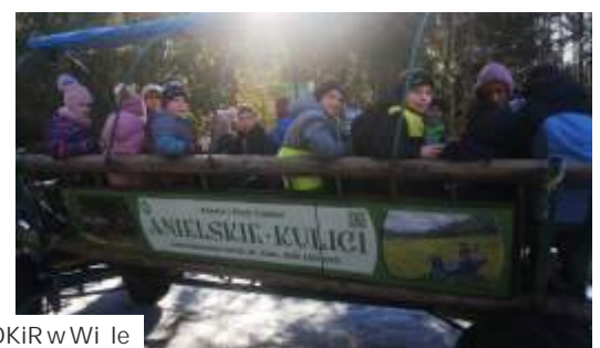
Kulig z GOKiR w Wi le