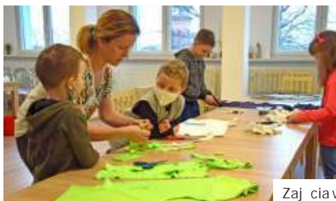
Zajęcia w Pracowni Krawieckiej