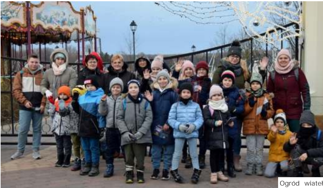
Ogród wiatel w Chorzowie