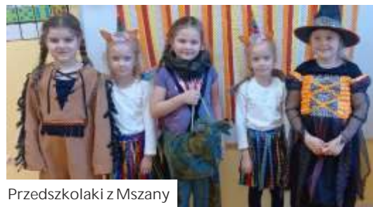
Przedszkolaki z Mszany