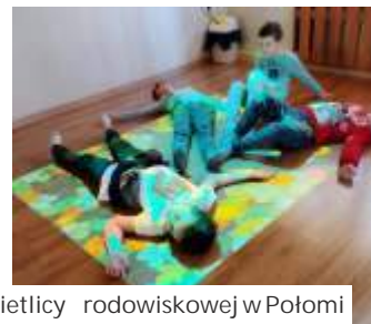
Zaj cia w wietlicy rodowiskowej w Potomi