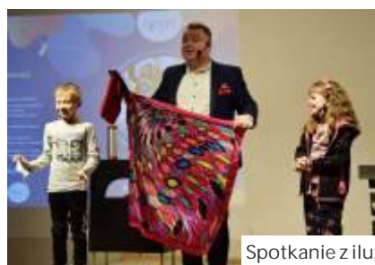
Spotkanie z iluzjonistą i sztuką