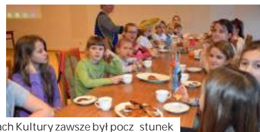
Na zajęciach stacjonarnych w Ośrodkach Kultury zawsze był poczęstunek