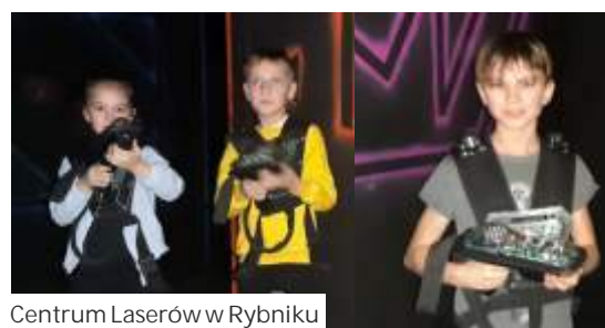
Centrum Laserów w Rybniku