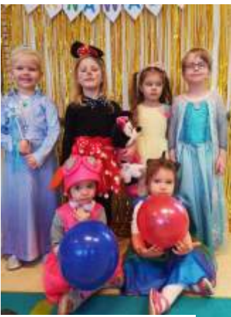
Przedszkolaki z Gogołowej