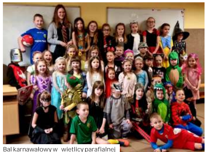
Bal karnawałowy w wietlicy parafialnej