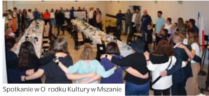
Spotkanie w Orodku Kultury w Mszanie

Turyści zapoznali się z historią "Marszu mierni" i dowiedzieli się o dotychczasowej wzajemnej współpracy. - Goście z Izraela interesowały także zasady udzielania pomocy humanitarnej obywatelom Ukrainy. Na nasz rachunek bankowy, uruchomiony specjalnie w celu pokrywania kosztów pomocy uchodźcom, wpłynęły rodki finansowe również z Izraela - przypomina wójt gminy Msza-