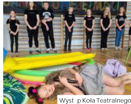
Występ Koła Teatralnego