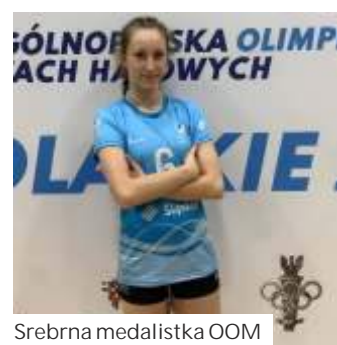
Srebrna medalistka OOM

W trakcie OOM zawodniczki ze I skasy wygrały wszystkie mecze w fazie grupowej, wier finale i półfinale. W finale uległy re-