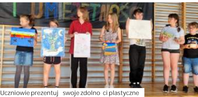
Uczniowie prezentują swoje zdolności plastyczne