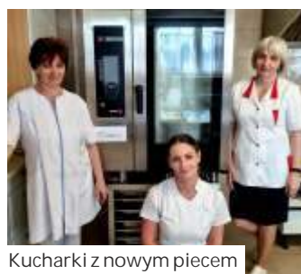
Kucharki z nowym piecem