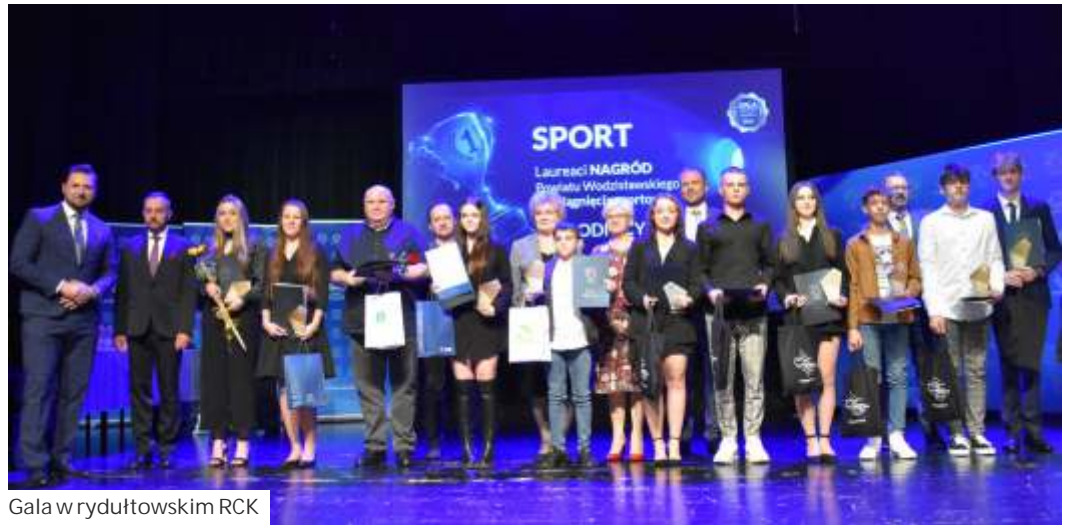
Gala w rydułtowskim RCK

skim Festiwalu „Zimowe Granie” (kategoria soli i duety 10-13 lat).