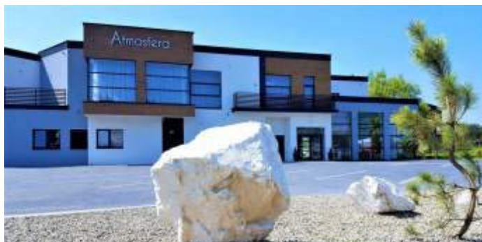
Atmosfera w Mszanie

Lokal w Mszanie został oddany do użytku w 2017 roku. Cechuje się nowoczesnym i praktycznym designem, jednocześnie jest przytulny i elegancki. Dom Przyjaciół Atmosfera to idealne miejsce na organizację wesela, przyjęcia rodzinnego lub firmowego albo konferencji. Firma reklamuje się tak i otwartością na klienta i jego pomysły dotyczące organizacji imprezy.