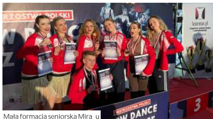
Mała formacja seniorska Mira u