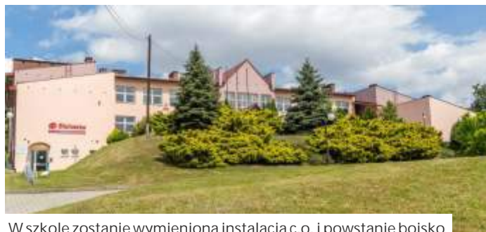
W szkole zostanie wymieniona instalacja c.o. i powstanie boisko