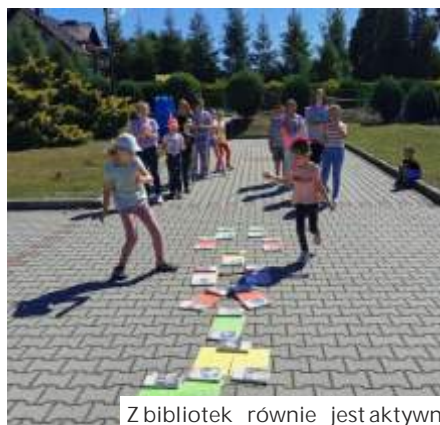
Z bibliotek równie jest aktywnie