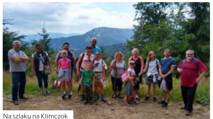
Na szlaku na Klimczok