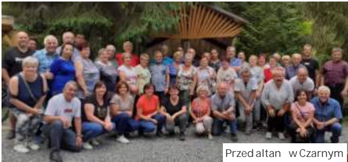
Przed altan w Czarnym

Zarząd Miejskiego Koła ZERIL zaprasza wszystkich członków na kolejne spotkanie, które odbędzie się 8 października, z okazji Dnia Seniora, w Orodku Kultury w Mszanie. Spotkanie będzie poświęcone z wyborami nowego zarządu. Rozpocznie o godz. 16.00. (mr)