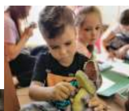
Wakacje w bibliotece w Gogołowej