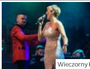
Wieczorny koncert gwiazd