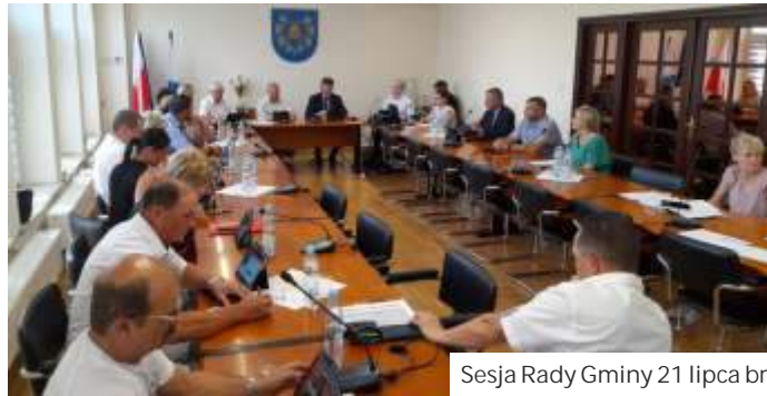
Sesja Rady Gminy 21 lipca br.

Obecna przebudowa będzie kontynuacją inwestycji rozpoczętej w zeszłym roku. Już za 3 miesiące droga na odcinku od Baszty aż do granicy z Markłowicami zostanie zmodernizowana. Koszt to ok. 1,5 mln zł.