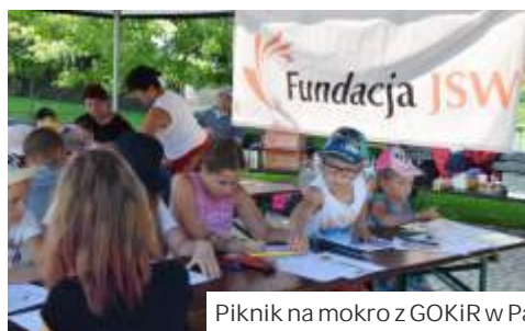
Piknik na mokro z GOKiR w Parku w Mszanie