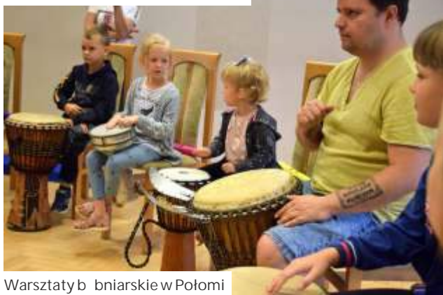
Warsztaty bębniarskie w Połomi