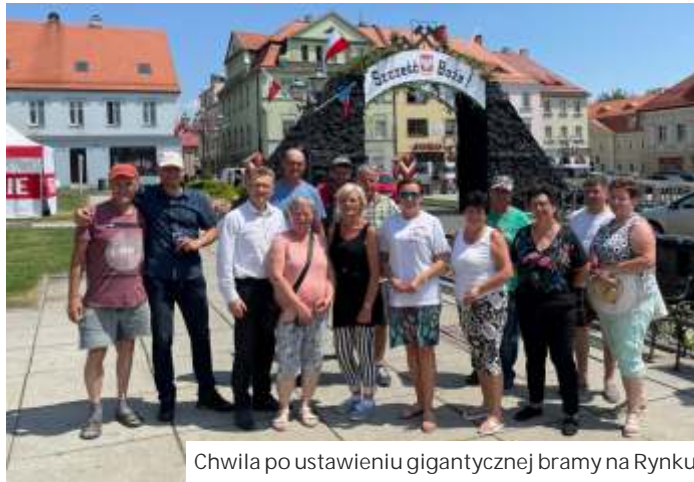
Chwila po ustawieniu gigantycznej bramy na Rynku