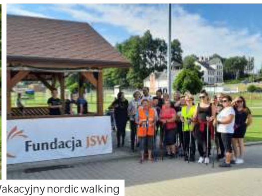
Wakacyjny nordic walking