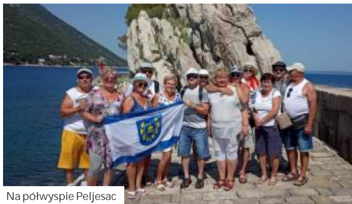
Na półwyspie Peljesac