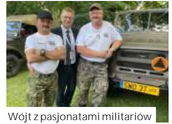
Wójt z pasjonatami militariów