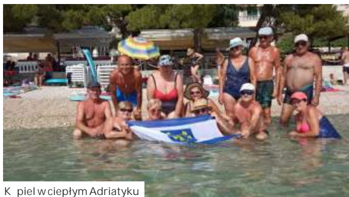
Kąpiel w ciepłym Adriatyku