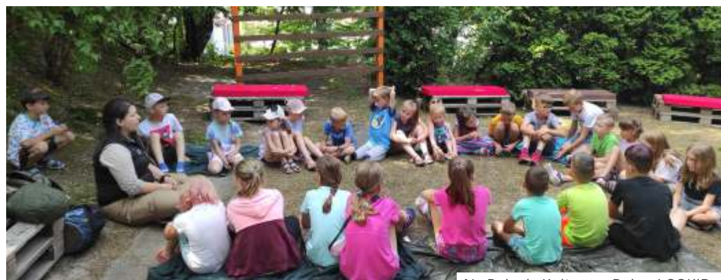
Na Polanie Kultury w Połomi GOKiR zorganizował m.in. zajęcia z survivalu