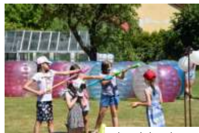
...i podobna impreza w Gogołowej