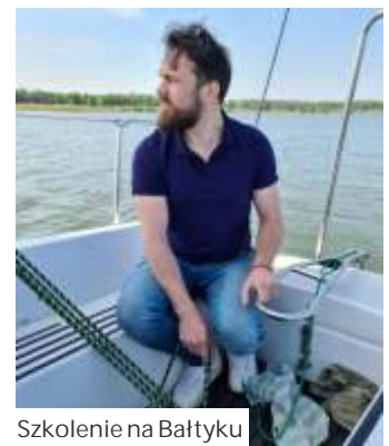
Szkolenie na Bałtyku