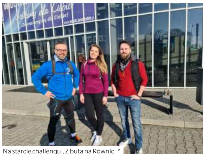
Na starcie challenge „Z buta na Równic”