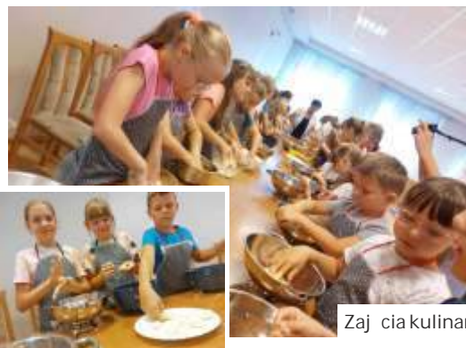
Zajęcia kulinarne z GOKiR Mszana

Warsztaty gry na instrumentach perkusyjnych, zajęcia kulinarne, „obóz przetrwania” na Polanie Kultury, pikniki z wodą w tle, we współpracy z Ochotniczymi Strażnikami Pożarnymi, konkurencje sportowe dla dzieci, turniej gigantycznych piłkarzyków, zabawy na Krytej Pływalni oraz ciekawe zajęcia czytelnicze i artystyczne - to wszystko działało w lipcu w ramach akcji wakacyjnej prowadzonej przez placówki kultury i sportu w naszej gminie. O Rodek Kultury, O Rodek Sportu oraz wietlica rodowiskowa OPS na zorganizowanie letnich atrakcji pozyskały darowizny od Fundacji JSW. Zajęcia dla dzieci (głównie z Gogołowej) organizowała także Biblioteka Gminna. Wszystkie cieszyły się dużym zainteresowaniem dzieci. A to dopiero połowa wakacji! (mro) O atrakcjach GOSWicej na str. 12