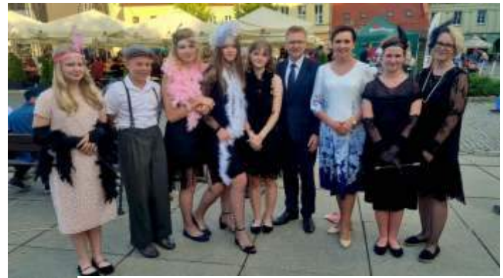
Uczniowie i absolwentki SP w Mszanie tworzyli klimat epoki