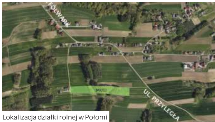
Lokalizacja działki rolnej w Połomi

Do sprzedaży w drodze II przetargu ustnego nieograniczonego jest teren w Mszanie w pobliżu Szybów Zachodnich, o łącznej powierzchni ponad 2 hektarów. I przetarg ustny nieograniczony odbył się 29 kwietnia 2022 r. i zakończył się wynikiem negatywnym. Cena wywoławcza nieruchomości do II przetargu została obniżona o 15.000 zł w stosunku do ceny wywoław-