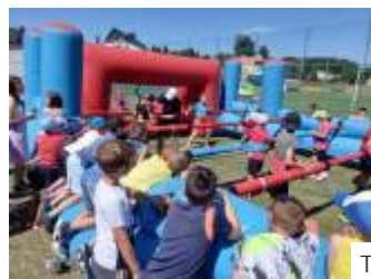
Turniej Gigantycznych Piłkarzyków

GOS był również organizatorem wakacyjnego Nordic Walking, co towarzyszyło zabawom w wodzie oraz spływu kajakowemu Ruda. (mr)