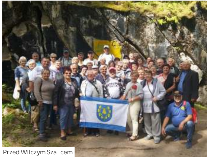
Przed Wilczym Szańcem

Członkowie Związku Emerytów, Rencistów i Inwalidów - Koło w Połomi w dniach 10-12 lipca zwiedzali Mazury. Program trzydniowej wycieczki był bardzo bogaty, choć nie zabrakło również czasu na odpoczynek. Seniorzy zwiedzili kilka zamków