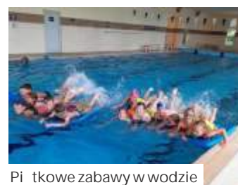
Piłkarskie zabawy w wodzie