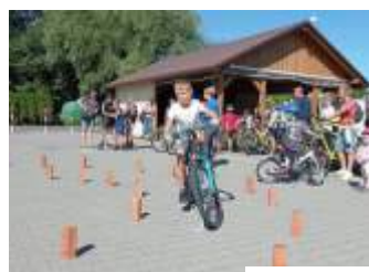
Wielobój nowoczesny w połomskim wydaniu