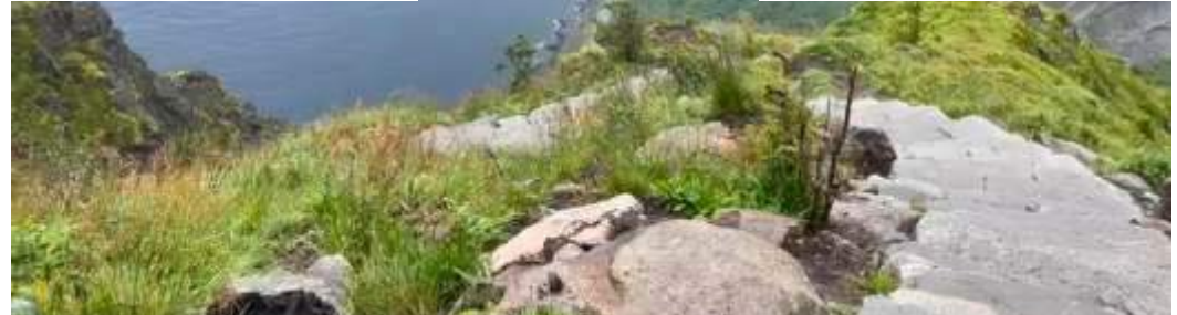
Ułożone przez Sierpów kamienne schody prowadzące na szczyt Reinebringen

Podobna architektura królowała także w wielu miejscowościach w Szwecji. Domy były bordowe lub te ciemnobrązowe, a w innych miasteczkach w jasnych, pastelowych kolorach.