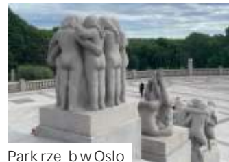
Park rzebiący w Oslo

tylko podłączyli mu pojazd do komputera, aby sprawdzić, czy wszystko jest w porządku. Było. Podróż mogła być kontynuowana.