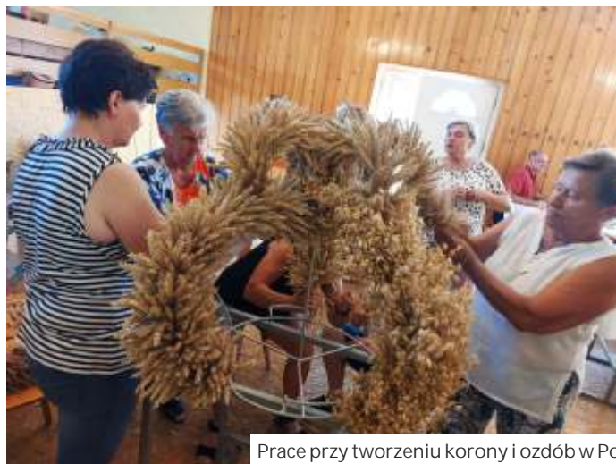
Prace przy tworzeniu korony i ozdób w Połomi

Również w Mszanie już gotowe piękne ozdoby dożynkowe wykonały pani z Rady Sołeckiej. W godzinnych wntkach wietlicy strażackiej spędziły wiele godzin na misternej i mądrej pracy, ale efekt jest wspaniały. Powstała korona dożynkowa w kształcie herbu