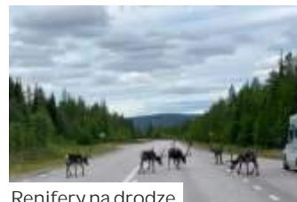
Renifery na drodze