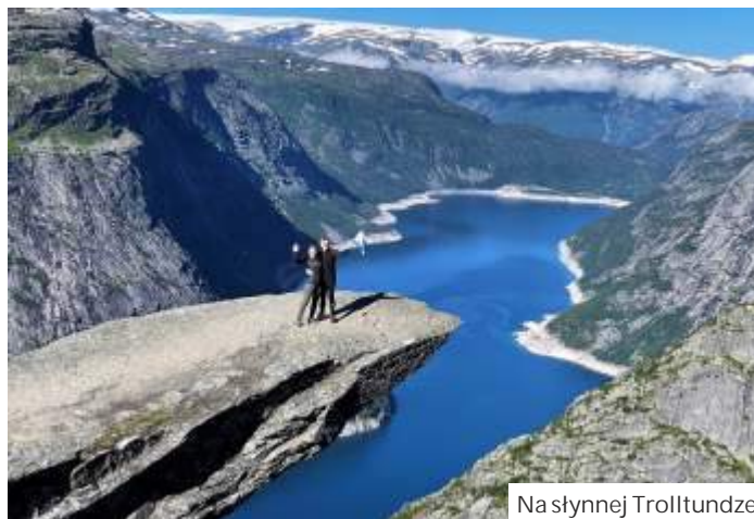
Na słynnej Trolltundze

Przez Niemcy pojechali do Danii, gdzie z miasta Frederikshavn przepawali si promem do szwedzkiego Geteborga. Na l d zjechali o 2.30 w nocy i po krótkim odpoczynku ruszyli wgł b Szwecji. Z wi kszych miast obejrzel Karlstad, nad du ym jeziorem Vanern, kieruj c si cały czas na północ. Nie poruszali si zbyt szybko, bo w Szwecji praktycznie nie ma autostrad. Im dalej na północ, tym drogi s w sze, ale ruch na nich jest niewielki.