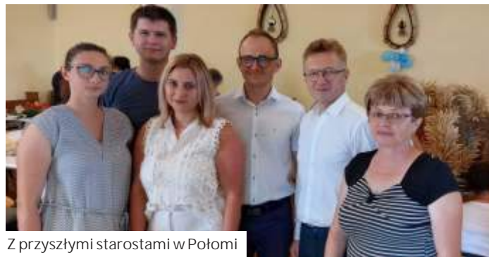
Z przyszłymi starostami w Połomi