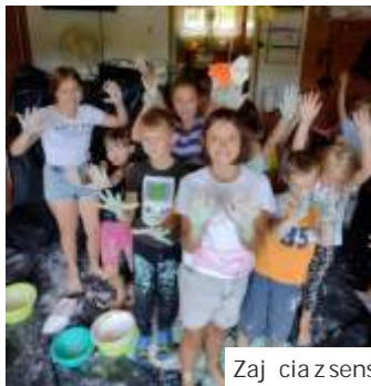
Zajęcia z sensoplastyki

Festyn był cz. ci oferty wakacyjnej wietlicy rodowiskowej prowadzonej przez OPS. W placówce przez całe wakacje odbywały się zajęcia z sensoplastyki, artystyczne, florystyczne i kulinarne. Bogata oferta była możliwa dzięki rodzkom Fundacji JSW. (ml)