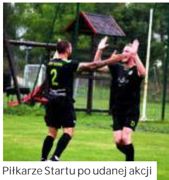
Piłkarze Startu po udanej akcji