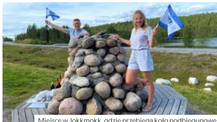
Miejsce w Jokkmokk, gdzie przebiega koło podbiegunowe