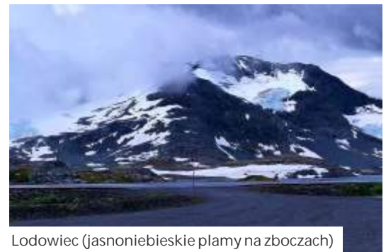
Lodowiec (jasnoniebieskie plamy na zboczach)

nogi. Pogoda jest pi kna, biwakuj nad jeziorem, opalaj si , spotykaj turystów z innych krajów. Potem jad 200 km dalej zobaczy kolejny cud natury - Preikestolen. To zjawiskowy klif, płaski z wierzchu, o wysokości ci 604 metrów, położony nad Lysefjordem. Pod nim otwiera si przepa , mo na dosta zawrotu głowy. Na szcz cie z parkingu mo na do niego doj w 1,5 godziny. Norweska przygoda powoli si