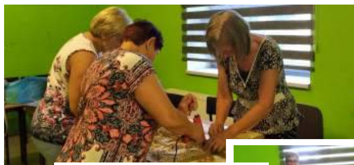
Praca Rady Sołeckiej w Mszanie i jej efekty