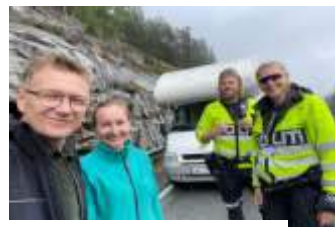
Spotkanie z policją i samodzielna naprawa auta

Mechanicy w warsztacie na przedmieściach Oslo rozkładali bezradnie nasze. Choć uszkodzonego kampera mogli zamówić, ale nie miał jej kto wymienić, bo pracownicy byli na urlopie. Kierowca z Mszany sam wziął się za zakasanie rękawów i wymienienie zepsutego rozrusznika, a w warsztacie