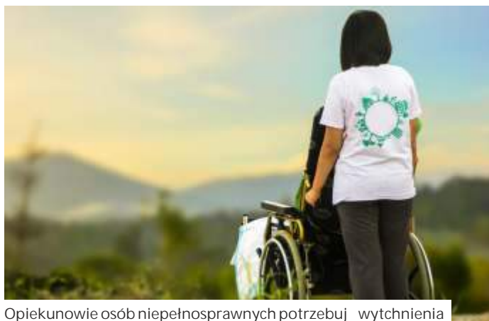
Opiekunowie osób niepełnosprawnych potrzebują wytchnienia

- Takie liwo ci daje nam Ministerstwo Rodziny i Polityki Społecznej ze środków Funduszu Solidarnościowego, a my jako OPS z nich korzystamy, by poprawić komfort życia opiekunów oraz osób niepełnosprawnych w naszej gminie. Opiekunowie, którzy każdego dnia 24 godziny na dobę zajmują się swoimi najbliższymi niepełnosprawnymi, potrzebu-