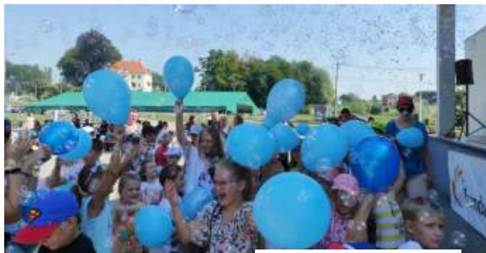
Piknik pod sceną plenerów

17 sierpnia na terenie zrewitalizowanego centrum Połomi odbył się festyn rodzinny zorganizowany przez Orodok Pomocy Społecznej w Mszanie. Dzieci zabawiło Studio Fama. Wśród atrakcji były m.in. kielbaski z grilla i lody, dzieciom zaplatano kolorowe warkoczki i udost