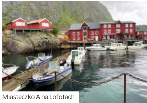
Miasteczko A na Lofotach

Po tej wycieczce kilka dni odpoczywaj , mocno bol ich