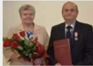
k , 3 wnuczki i jedn prawnuczk .

Po raz pierwszy zobaczyli si w jastrz bskiej cukierni "Kapryst" - ona przysłała tam po pracy, a on wpadł z kolegami na lody. lub wzi li 31 sierpnia 1972 r. Maj córki, 3 wnuczki i jedn prawnuczk .