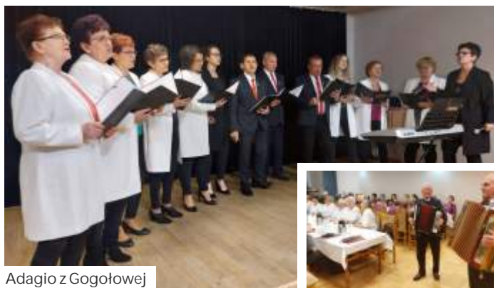
Adagio z Gogołowej