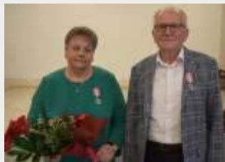
1 wnuczk i jednego prawnuka.

Spotkali si po raz pierwszy w kawiarni w wodzisławskim Domu Kultury. Po kilku latach "zolyt" powiedzieli sobie "tak" 22 pa dzienika 1972 roku. Maj jednego syna,