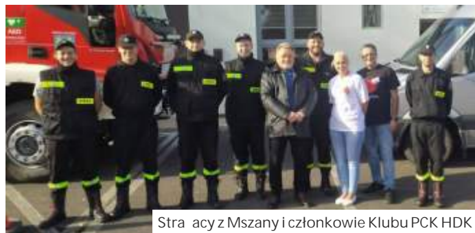
Strażacy z Mszany i członkowie Klubu PCK HDK