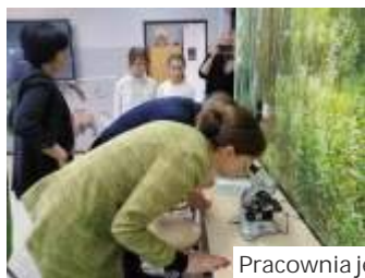
Pracownia jest piękna i kolorowa