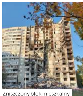
Zniszczony blok mieszkalny