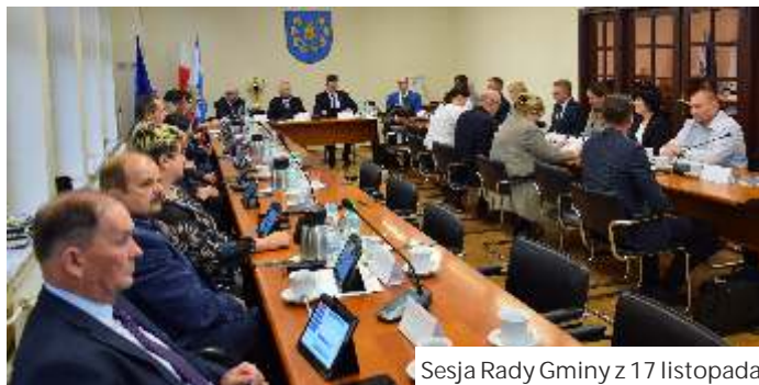
Sesja Rady Gminy z 17 listopada

- Decyzje w sprawie podatków zawsze należą do trudnych, ale w obecnej sytuacji ekonomicznej kraju oraz wobec wielu zadań realizowanych przez gminę nie jest możliwe dalsze utrzy-