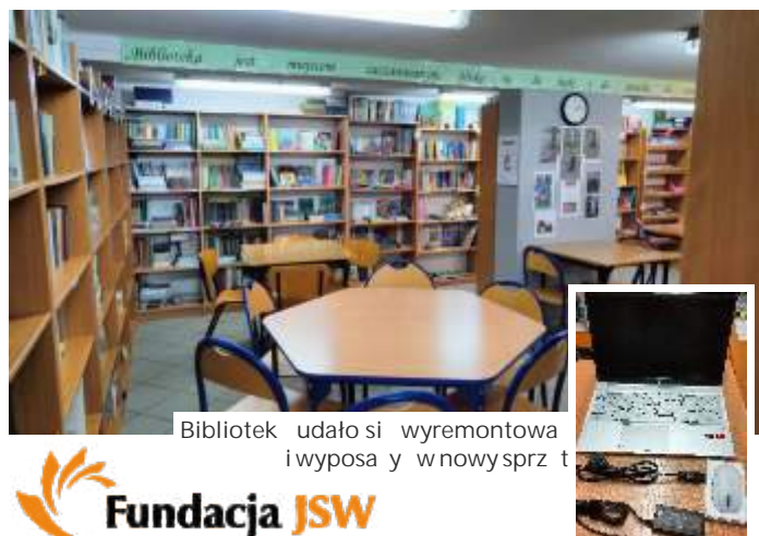
Bibliotek udało się wyremontować i wyposażać w nowy sprzęt