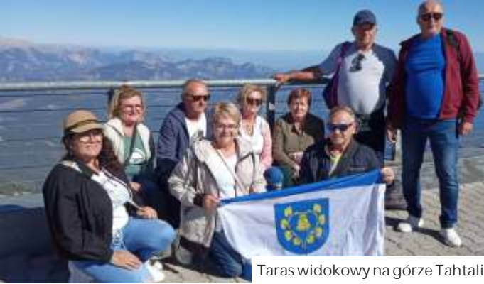
Taras widokowy na górze Tahtali