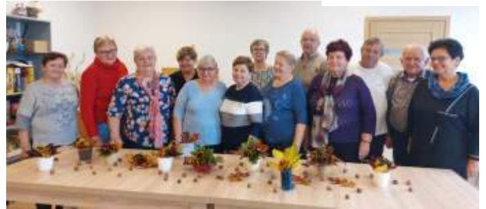
Wizyta w muzeum