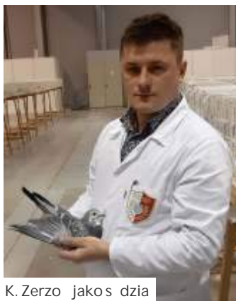
K. Zerzo jakos dzia

Tym bardziej, e wicemistrzem Polski nie został do tej pory aden hodowca z Okr gu l sk Południe w całej historii okr gu.