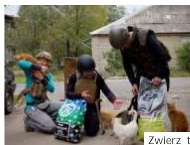
Zwierzęta te zostają sierotami na wojnie

- To nie obaj b dzieemy w tym samym czasie na tym samym moście. wydawało się nieprawdopodobne, a jednak... dok. na str. obok