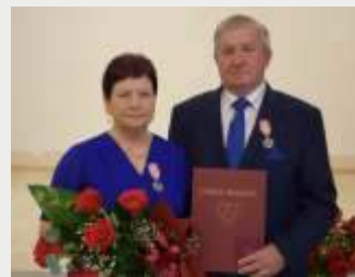
2 córki i syna, mają 5 wnuczek i 2 wnuczki.

Widywali się w autobusie, którym wspólnie dojeżdżali do szkół w Rybniku, a w oko wpadli sobie na zabawie w lokalu "U Marka". Pobrali się po 4 latach znajomości, 23 sierpnia 1972 roku. Wychowali