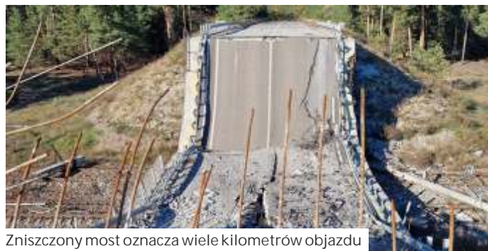
Zniszczony most oznacza wiele kilometrów objazdu

W Dnieprze zatrzymali się w restauracji, której właścicielem był przez lata kucharzem w Polsce. - Pierwszy raz w życiu jadłem zielony barszcz. Przepyszny. W ogóle spotkałem wielu ludzi, którzy mieli kontakty