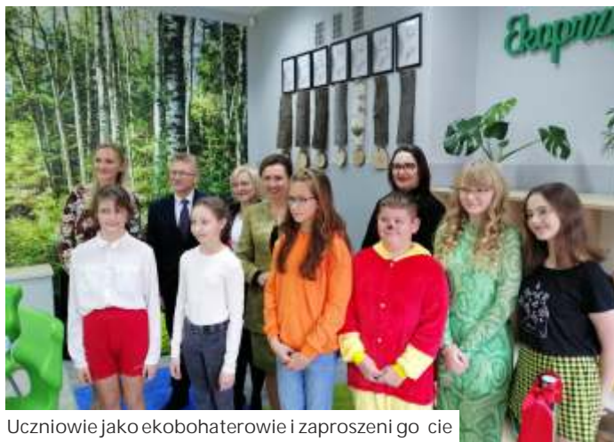
Uczniowie jako ekobohaterowie i zaproszeni goście

Podczas uroczystości otwarcia uczniowie przedstawili spektakl pt. "W bajkowym świecie Ekobohaterów". Na otwarcie przybyli goście, w tym przedstawiciele WFO i GW. Nowa pracownia na pewno wpłynie na podniesienie jakości kształcenia.