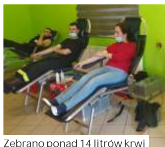
Zebrano ponad 14 litrów krwi

Podziękowania dla organizatorów przekazał Klub PCK HDK Pszów, mający patronat nad lokalnym krwiodawstwem. (mr)