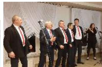
W spotkaniu wzięło udział blisko 100 osób