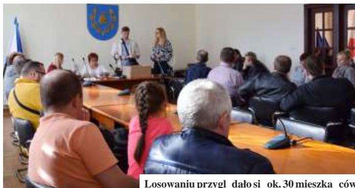
Losowaniu przysięgło ok. 30 mieszkańców

Osoby z kolejnymi numerami na listach mogą jednak także