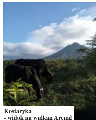
Kostaryka - widok na wulkan Arenal

- Nawet zaliśmy przyjaźnić się z ludźmi z innymi na drugim końcu świata, widzieliśmy małpy, leniwce czy iguany