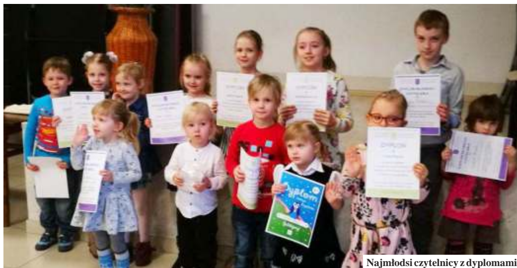
Najmłodszy czytelnicy z dyplomami

- Celem akcji czytelniczych jest zachowanie mieszkańcom gminy do regularnych spotkań z książką, rozbudzenie zainteresowania literaturą oraz promocja usług bibliotecznych w lokalnym środowisku. Spotkali się z naszymi Czytelnikami, aby podkreślić, jak bardzo cieszymy się z ich obecności i nagrodzić zapalonych w dziedzinie tajników literatury - mówi