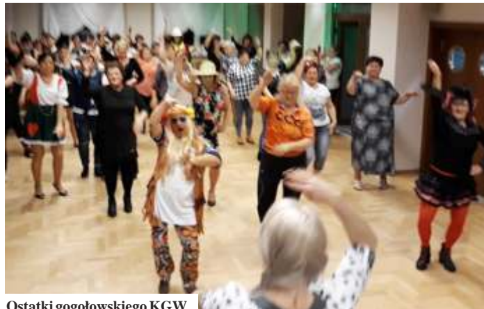
Ostatki gogołowskiego KGW