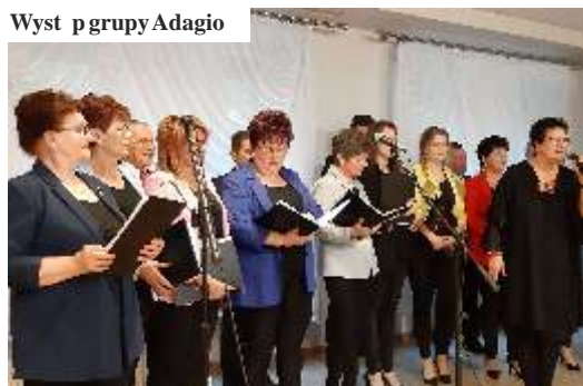
Występ grupy Adagio

Panie i zaproszeni goście czekali na domowymi piątkami, a na scenie wystąpił zespół Adagio z Gogołowej. Była to pierwsza impreza naszych stowarzyszeń w odnowionym Orodku Kultury w Połomi. (mk)