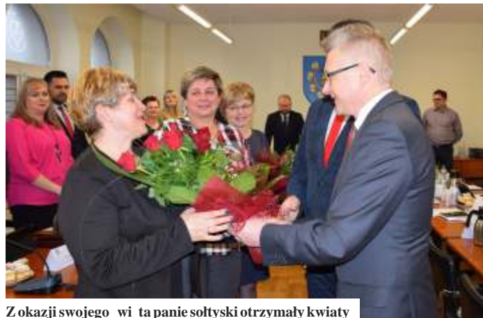
Z okazji swojego święta pani sołtyska otrzymała kwiaty

Podjęto również uchwałę w sprawie ustalenia wysokości ekwiwalentu pieniężnego dla członków Ochotniczych Straż Pożarnych. Na podstawie ustawy o ochronie przeciwpożarowej członek ochotniczej straży pożarnej, który uczestniczył w działaniu ratowniczym lub szkoleniu po arniczym organizowanym przez Państwowy Straż Pożarny lub gminny otrzymuje ekwiwalent pieniężny. Wysokość ekwiwalentu ustala rada gminy w drodze uchwały. Zgodnie z obowiązującym od 1 grudnia 2008 roku uchwał