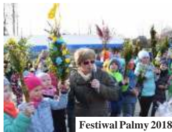
Festiwal Palmy 2018

Dla osób, które wykonają palmy i sianki pochwal przewidziano nagrody. Uczestnicy imprezy ustawią te gigantyczne palmy. Będzie konkursy