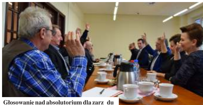
Głosowanie nad absolutorium dla zarządu