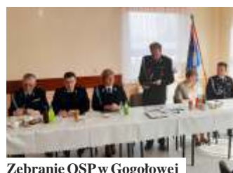
Zebranie OSP w Gogołowej