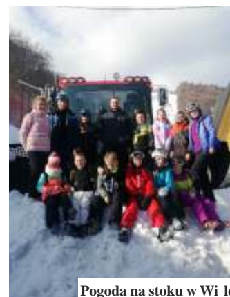
Pogoda na stoku w Wile-Jaworniku była wymarzona

Po zabawie na lodzie i stoku był czas na gorące czekolady i posiłek. Uczniowie już nie mogą się doczekać następnych aktywnych zajęć. Organizatorem wyjazdów była Jagna Adamek. (ja)