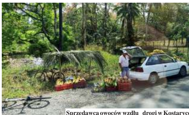
Sprzedawca owoców wzdłuż drogi w Kostaryce

byłyce w ich środowisku naturalnym, mieszkaliśmy w hotelu stojącym na palach, wybudowanym w środku dżungli. Mieliśmy też okazję spróbować całej masy nowych rzeczy - od spaceru u stóp wulkanu do raftingu po rzece na pontonach, który bardzo przypadł mi do gustu, mimo że kilka razy prawie wypadłam do wody. Słowem: przygoda życia - podsumowuje Aleksandra Baran. (mk)