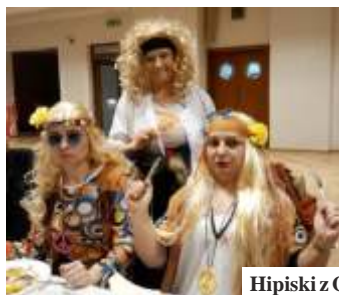
Hipiski z Gogołowej i Mszany