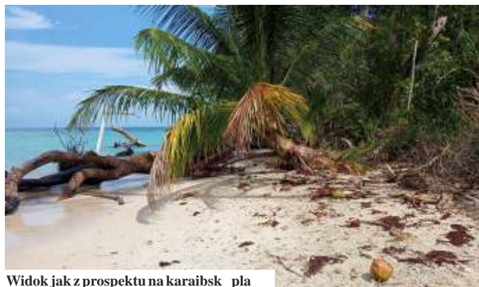
Widok jak z prospektu na karaibską plażę