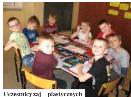
Uczestnicy zajęć plastycznych

Więcej o działalności wietlicy możecie przeczytać na blogu „artystyczna wietlica”, do którego link znajduje się na stronie internetowej SP w Połomi. (ja)