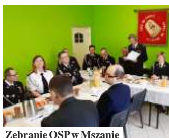
Zebranie OSP w Mszanie