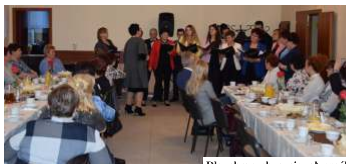
Dla zebranych za śpiewał zespół Adagio