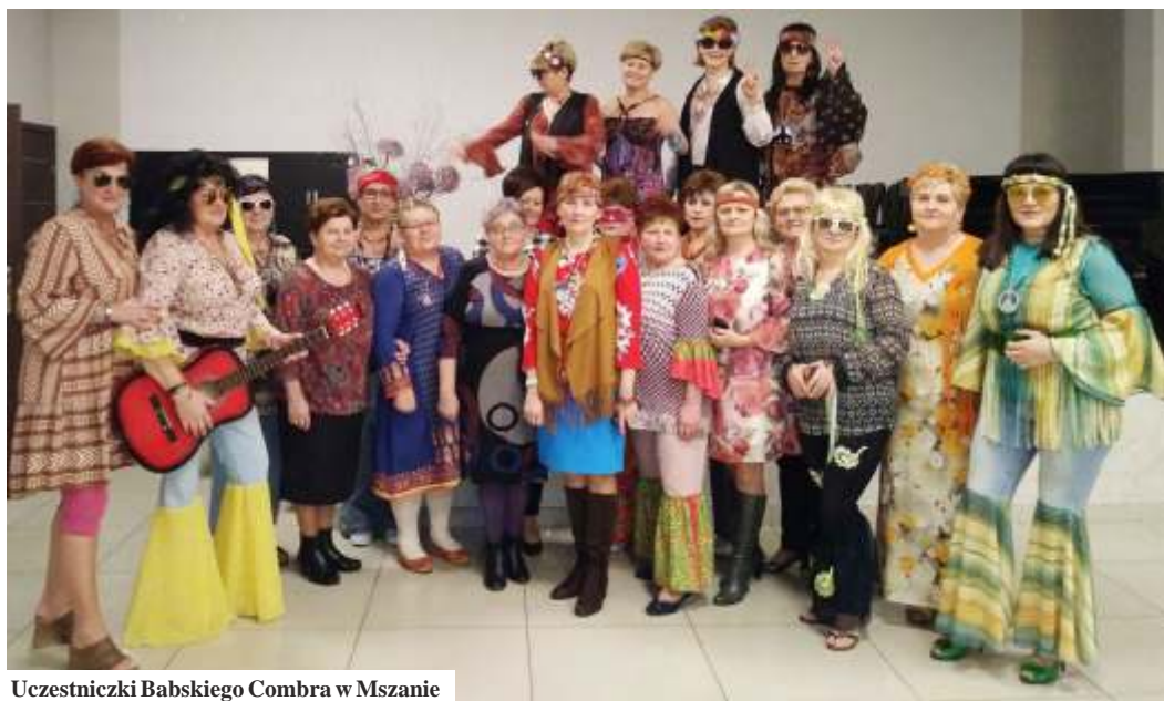
Uczestniczki Babskiego Combra w Mszanie

5 marca podobną imprezę dla swoich członki przygotował zarząd KGW w Gogołowej. Panie bawiły się do późna zgodnie z hasłem "Jak ostatki, to ostatki, niech się trząsą babskie zadki". (mk)