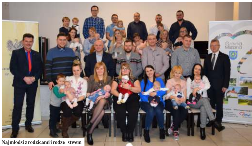
Najmłodzi z rodzicami i rodzicami

Od października do końca grudnia 2018 r. w Mszanie urodziło się 21 dzieci, w tym 12 dziewczynek i 9 chłopców. Rodzice, którzy nie mogli być obecni w GOKiR, mogli odebrać maskotki w Punkcie Obsługi Klienta UG w Mszanie. (mk) Galeria zdjęć na: www.mszana.ug.gov.pl i na fb