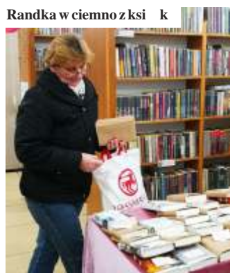
Randka w ciemno z książkami