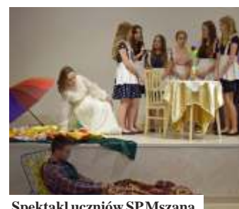
Spektakl uczniów SP Mszana

Podstawowej w Mszanie, ze spektaklem "O rozkapryśzonej królewnie". Zaśpiewał także zespół folklorystyczny Mszanianka. (mk)