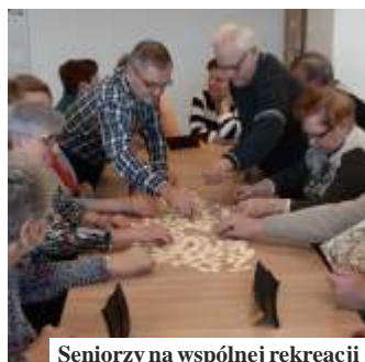
Seniorzy na wspólnej rekreacji

Wskazówki jak nie da się naci gn nieuczciwym sprzedawcom, jak sprawnie obsługiwać komórkę czy komputer, pierwsza pomoc ukierunkowana na opiekę nad dziećmi,